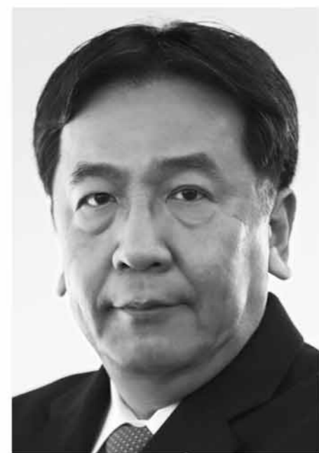
立憲民主党 代表 枝野幸男