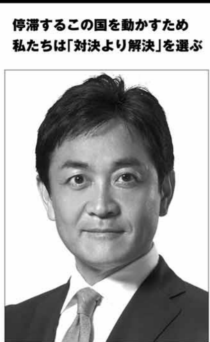
代表 玉木雄一郎 動け、日本。