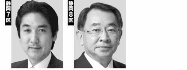
城内みのる しおのや立