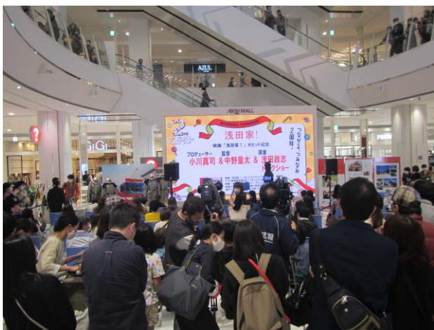
商業施設での 映画「浅田家！」イベント