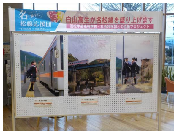
美杉総合支所 1 階ロビーでの 名松線の魅力 P R ポスター展示