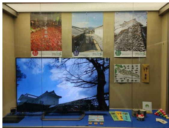
第4回検討会議 令和3(2021)年1月27日 亀山市紹介DVD上映(東京事務所内展示コーナー)