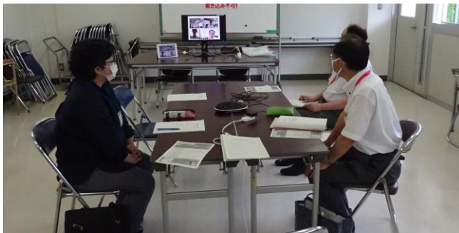
第2回検討会議（参集とオンライン参加の選択方式で実施）