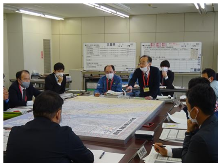
タイムライン(案)の図上訓練 第2回部会 令和2(2020)年11月17日