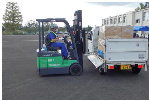
伊賀地方災害対策部広域防災拠点実働訓練