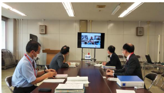
策定、公表に向けての協議 第2回検討会議 令和3(2021)年3月16日