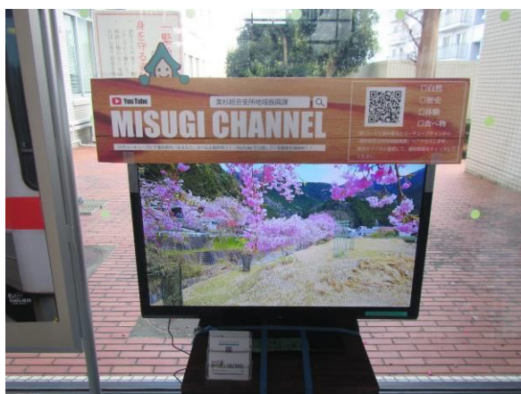
ドローンで撮影された 美杉地域 P R 動画の放映