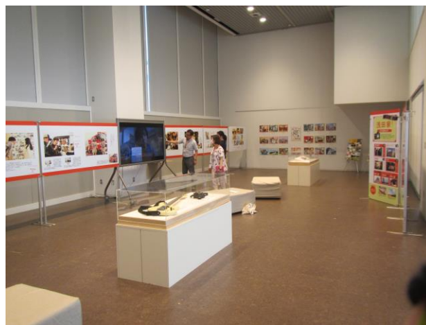
県有施設での 映画「浅田家！」パネル展