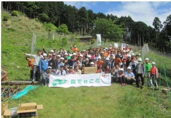
社員による森づくり活動

本県では、平成 18（2006）年度から、「企業の森」制度を実施しており、令和 2（2020）年度末までに 56 か所で協定が締結され、約 314ha の森林が整備されています。