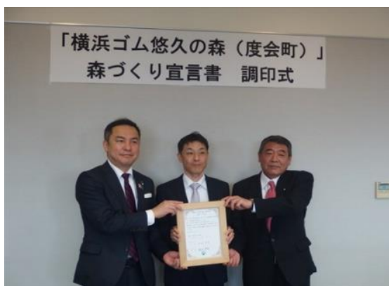
森づくり宣言書調印式