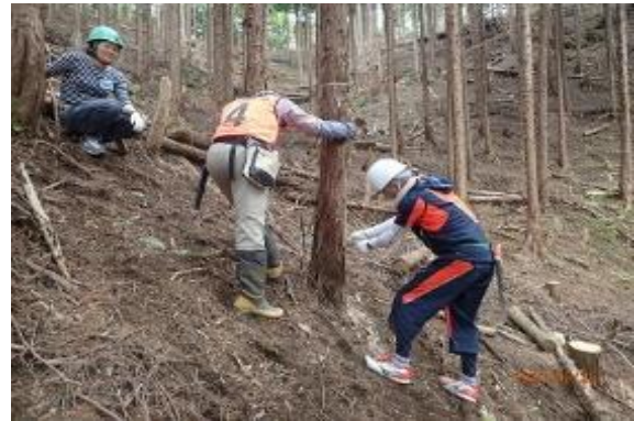
社員による森づくり活動