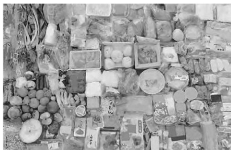
捨てられた手付かずの食品例

食べられるのに捨てられている食品ロスのこと。 日本では、年間600万トン以上の食品ロスが発生しています。 食品ロスの中には、手付かずの状態ですべて捨てられている食品もあり、この状況を多くの方に知っていただくことが大切です。