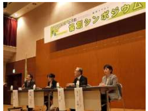
「協創シンポジウム」

さらに、NPO 活動を周知し、県民の皆さんの理解を深めるため、12 月を「市民活動・NPO 月間」として新たに設け、さまざまな主体と協働して 9 地域で 18 イベントを開催するとともに、集大成イベントとして「協創シンポジウム」を、平成 26 年 1 月に開催しました。