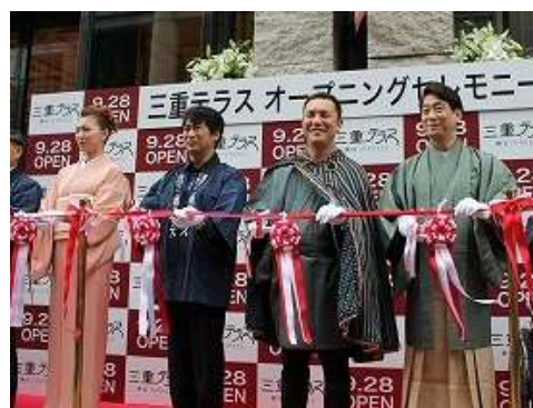
「三重テラス」オープニングセレモニー

首都圏における営業機能の強化に向けては、9月にオープンした首都圏営業拠点「三重テラス」において、ゲストを招いて三重の旬な魅力を語り合う「知事トークライブ」、三重の食材を引き立てるペアリング講座、県内でのフィールドワークを組み入れたさまざまな講座など多目的ホールを活用したイベント（126件）を開催しました。来館者数は、平成26年3月末で約27万5千人となり、当初目標の11万人を突破しました。