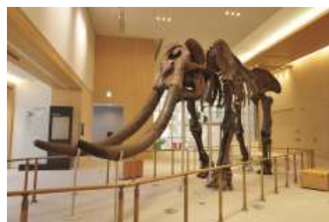
三重県総合博物館（M i e M u） ミエゾウ

生涯学習の振興については、「ともに考え、活動し、成長する博物館」を理念とする三重県総合博物館（M i e M u）の平成 26 年 4 月開館に向けて、共感や期待感を喚起するよう、開館 1 年前、3 か月前、1 か月前など節目の時期に合わせて集中的にイベントや広報活動を展開するとともに、参加型の MMM（みえマイミュージアム）プロジェクトの実施や企業パートナーシップ、交流展示の企画などを通して民間企業等との連携に取り組みました。