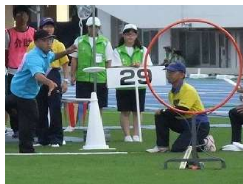
全国障害者スポーツ大会

平成 33 年に本県で開催される全国障害者スポーツ大会に向けては、障がい者スポーツ競技団体の設立を支援し、新たに 1 団体が設立されました。