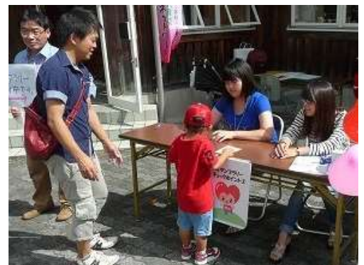
第 8 回子育て応援！わくわくフェスタ （スタンプラリー）

あわせて、きめ細かな少子化対策を多様な主体と連携して推進するため、平成 26 年度に、子ども・家庭局に「少子化対策課」を設置することとしました。