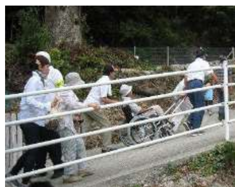
三重県総合防災訓練（津波避難訓練）

平成25年度に実施した「防災に関する県民意識調査」では、東日本大震災発生後も「危機意識を変わず持ち続けている」人が35%いる一方で、「時間の経過とともに危機意識が薄れつつある」と回答した人が45%にのぼり、時間の経過とともに危機意識の低下が進んでいることが明らかになりました。こうした状況のもと、震災で芽生えた意識を行動に結びつけ、さらには、防災・減災対策が日常生活の中に溶け込んで、当たり前ものとなっている「防災の日常化」の定着へとつなげて、災害に強い三重県が子や孫の世代まで引き継がれていくことをめざした「三重県新地震・津波対策行動計画」を平成26年3月に策定しました。