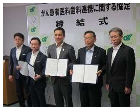
がん患者医科歯科連携に関する協定締結式

また、ホテル等における食材の不適正表示事案が県内においても発生したことから、食材表示の適正化のため、不当商取引指導専門員を2名増員し、研修会開催や講師派遣、自己点検等の自主