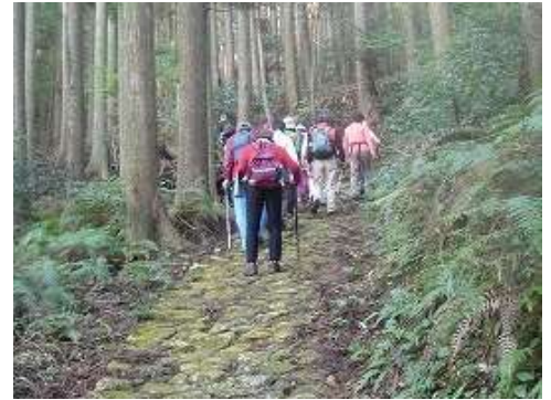
熊野古道伊勢路霊場めぐりモデルウォーク（風伝峠）

東紀州地域の活性化については、平成 26 年の熊野古道世界遺産登録 10 周年に向けて、熊野古道伊勢路を「幸結びの路」として情報発信するとともに、神宮来訪者等への情報発信や首都圏営業拠点「三重テラス」*における伊勢と熊野の歴史的なつながりを紹介する熊野古道セミナーの開催、熊野古道伊勢路沿いの霊場を巡るモデルウォークなどを実施しました。また、東紀州地域振興公社では、県外での観光展、物産展に出展するなど情報発信を行いました。さらに、熊野古道センターでは、企画展や交流イベントを開催するとともに、紀南中核的交流施設では、伊勢志摩の宿泊施設と連携した魅力的な宿泊プランの設定等を行いました。これらの取組を行った結果、紀伊半島大水害からの観光面での復興が着実に進み、熊野古道伊勢路への年間来訪者数は、過去最高の 30 万 8 千人（対前年比 12.7%増）となりました。