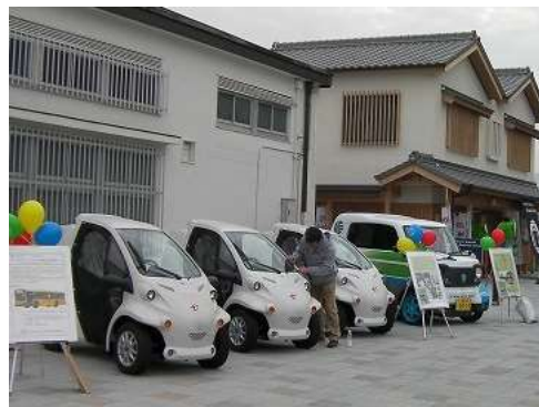
小型電気自動車の普及活動（伊勢市駅前）

また、低炭素なまちづくりを進めるため、伊勢市における電気自動車等を活用した低炭素社会モデル事業において、平成24年度に策定した協議会の取組や各主体の役割等を定めた行動計画「おかげさまAction!」に基づき、小型電気自動車の導入などその環境を整備しました。