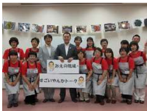
すこいやかトーク

広聴広報の充実については、知事が現場に赴き地域で活動する県民の皆さんと対話する「みえの現場・すこいやかトーク」を35回開催するなど広聴活動に取り組みました。また、県民の皆さんへの情報発信の強化として、テレビのデータ放送による「県政だより みえ」の試験放送を実施（11月、平成26年2、3月）し、平成26年4月からの導入に向けた取組を進めるとともに、さまざまな広報媒体の特性を生かし、県政情報をわかりやすく、より効果的に提供するための戦略である「三重県広聴広報アクションプラン（仮称）」の平成26年度策定に向けた検討に着手しました。