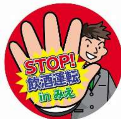
飲酒運転 ゼロ をめざすキャンペーンロゴマーク