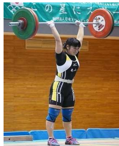
全国高等学校ウエイトリフティング競技選抜大会 女子 69kg 級優勝（県立亀山高等学校）

南部地域の活性化については、南部地域活性化基金を活用して若者の働く場の確保や定住の促進に向けた複数市町の主体的な取組が本格的に動き出し、地域活性化局とともに各取組に積極的に参画し、事業内容の充実を図るための助言等協力・支援を行いました。また、市町や他県との共同による三大都市圏での移住相談会やセミナーの開催、メールマガジンの発行やホームページの充実など県南部地域への移住促進に取り組みました。集落機能を維持する取組については、6 市町のモデル地域において実施し、2 年目となる尾鷲市と志摩市では、住民と学生の話し合いを通じて、地域の魅力を発信する具体的な取組が動き出すなど成果があらわれました。また、大学と連携して市町職員等を対象に人材育成講座を開催するなど、サポート人材のスキルアップを図りました。