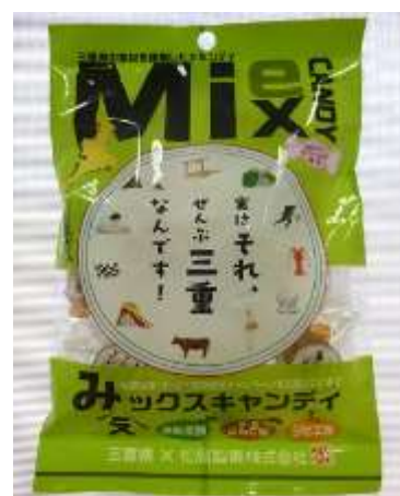
みえフードイノベーションから生まれた商品

県産品の販路拡大と県内への誘客を図るため、神宮式年遷宮*と連動した「平成おかげ参りプロジェクト」を10月から実施し、全国15店舗の百貨店で物産展を開催しました。また、台湾やタイでの三重県物産展等を通して、現地での営業展開や定番化への足がかりを築きました。さらに、農林水産物の輸出促進の取組をさらに進めるため、「三重県農林水産物・食品輸出促進協議会」を平成26年3月に設置しました。