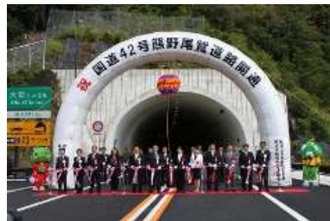
熊野尾鷲道路(三木里～熊野大泊)開通式

さらに、地域と一体となった国などへの粘り強い働きかけにより、熊野市大泊町から新宮市間については、地域の皆さんの声や学識経験者等の意見をふまえ、概ねのルートが4月に決定されるとともに、紀宝町から新宮市間(約2.4km)については、新宮紀宝道路(熊野川河口大橋(仮称)含む)として、5月に新規事業化され、詳細なルートや構造を決定するための地質調査や測量等の現地調査に着手しました。加えて、熊野市大泊町から熊野市久生屋町間(約6.7km)が熊野道路として新規事業化されることが、平成26年3月に公表されるなど、紀伊半島のミッシングリンク*の解消に向け前進しました。