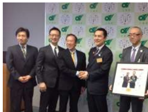
サンディスク「イノベーションセンター」開設の発表

企業誘致の推進については、成長産業における投資やマザー工場化*の促進、外資系企業の誘致、県内企業の再投資促進、サービス産業の立地促進などを柱とする新たな企業投資促進制度「マイレージ制度*」を活用し、誘致活動を展開しました。その結果、企業誘致件数は、65 件と過去 4 年間の実績と比べ、大きく増加しました。また、国際競争力のある外資系企業の誘致に向け、外国商工会議所やグレーター・ナゴヤ・イニシアティブ協議会（GNI）*等の事業への参加や、大使館など在外外国公館や関係機関等とのネットワーク構築に取り組むとともに、8 月の米国ミッションでは、インテル、サンディスク、ボーイング等のグローバル企業にトップセールスを行いました。こうした取組により、サンディスクが四日市市内に単独で「イノベーションセンター」を開設することが、11 月に決定しました。さらに、三菱重工業の次世代リージョナルジェット機（MRJ*）の量産に向けた拠点展開構想が、平成 26 年 2 月に公表され、同社松阪工場が量産拠点の一つに選ばれました。