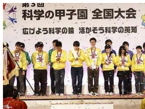
「第 3 回科学の甲子園全国大会」優勝 (県立伊勢高等学校)

また、社会経済のグローバル化が進展する中、チャレンジ精神、課題解決力、日本人・三重県人としてのアイデンティティ、英語によるコミュニケーション力等を育成することで、子どもたちがグローバル社会で主体的に活躍し、他者と共に生きていく基盤を確立するため、「グローバル三重教育プラン」を平成 26 年 2 月に策定しました。このプランの取組を推進するため、レゴジャパン株式会社レゴエデュケーションと「三重県における教育振興のための研究等に関する包括協定」を締結しました。