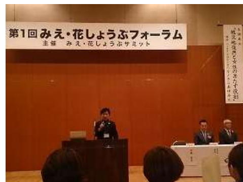
第1回みえ・花しょうぶフォーラム

女性の就労支援については、託児付きで就労支援相談を県内2か所で定期的実施するとともに、就労支援セミナーや子育てしながら働く先輩女性（ロールモデル）との意見交換会（サロン）を開催しました。こうした取組を通じて、相談利用者のうち43名が再就職することができました。また、既に社会で活躍している女性の交流を深めるとともに、更なる女性の社会進出と活躍を促進するための仕組みとして「みえ・花しょうぶサミット」を発足し、フォーラムを開催（210名参加）し、分野を超えた交流が始まりました。