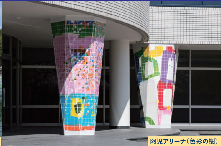
阿児アリーナ(色彩の樹)