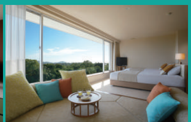
洋室(デラックスルーム)一例