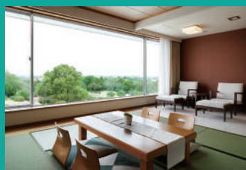
和室(スーペリアルームタタミ)一例