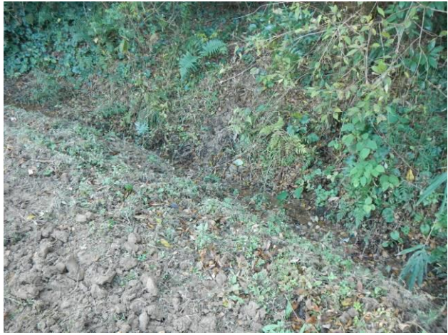
写真 4-3-34 整備状況(耕起工：耕起前・保全区域A：令和2年11月16日)