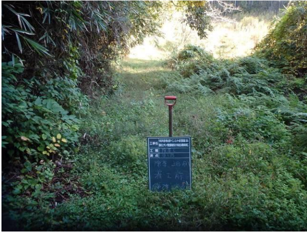
写真 4-3-25 整備状況(除草工：除草前・保全区域A・通路：令和2年11月14日)