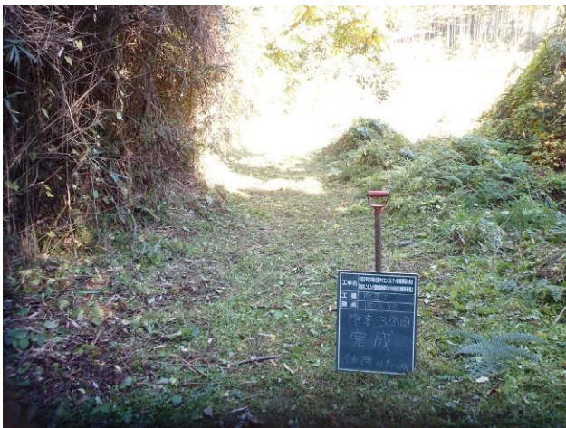
写真 4-3-27 整備状況(除草工：除草後・保全区域A・通路：令和2年11月16日)