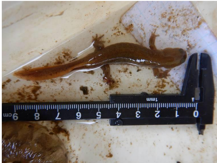
写真 4-1-31 確認した成体（令和 3 年 3 月 8 日）