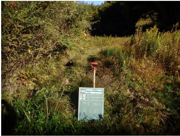
写真 4-3-7 整備状況(除草工(機械))：除草前・保全区域A・畦畔等：令和2年11月14日)