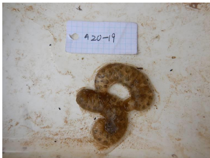
写真 4-1-24 確認した卵囊 (A-19) (令和3年3月8日)