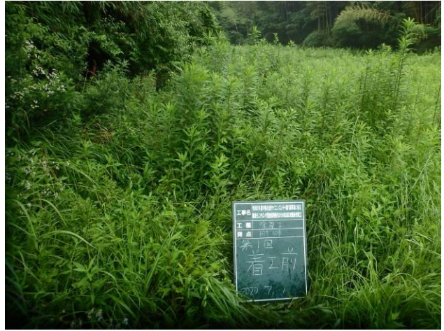
写真 4-3-1 整備状況(除草工(機械) : 除草前・保全区域A・畦畔等 : 令和2年7月1日)