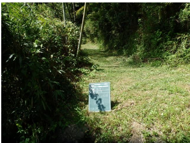
写真 4-3-24 整備状況(除草工(機械) : 除草後・保全区域A・通路 : 令和2年8月18日)