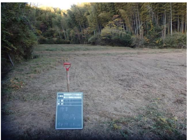
写真 4-3-30 整備状況(除草工：除草後・保全区域A・放棄水田：令和2年11月16日)