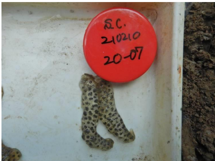
写真 4-1-12 確認した卵囊 (A-07) (令和 3 年 2 月 10 日)