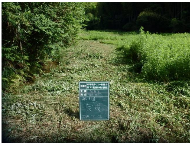
写真 4-3-3 整備状況(除草工(機械) : 除草後・保全区域A・畦畔等 : 令和2年7月2日)