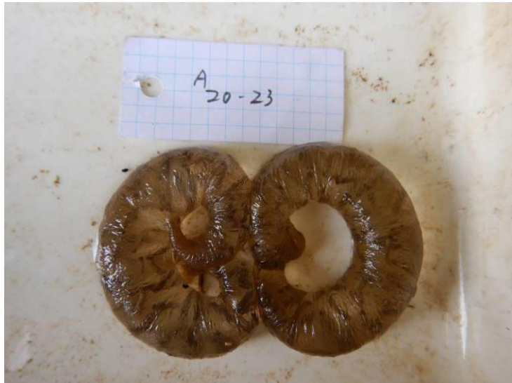
写真 4-1-28 確認した卵囊 (A-23) (令和3年3月8日)