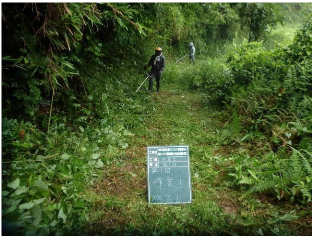
写真 4-3-20 整備状況(除草工(機械))：除草中・保全区域 A・通路：令和 2 年 7 月 1 日)