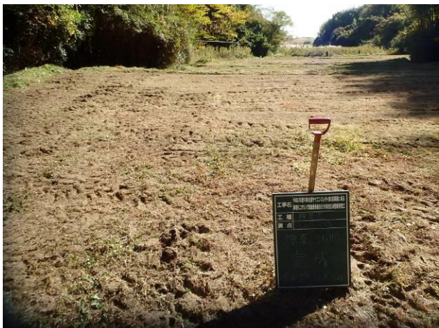
写真 4-3-18 整備状況(除草工(人力))：除草後・ハナショウブ 植栽地：令和2年11月16日