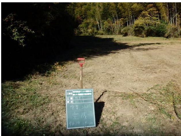
写真 4-3-9 整備状況(除草工(機械))：除草後・保全区域A・畦畔等：令和2年11月16日)