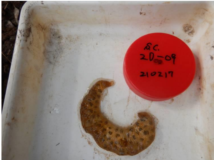
写真 4-1-14 確認した卵囊 (A-09) (令和 3 年 2 月 17 日)