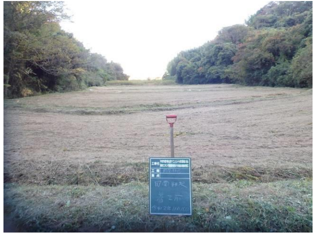
写真 4-3-31 整備状況(耕起工：耕起前・保全区域 A：令和 2 年 11 月 16 日)