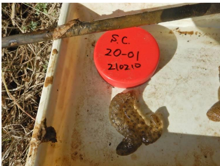
写真 4-1-6 確認した卵嚢 (A-01) (令和 3 年 2 月 10 日)