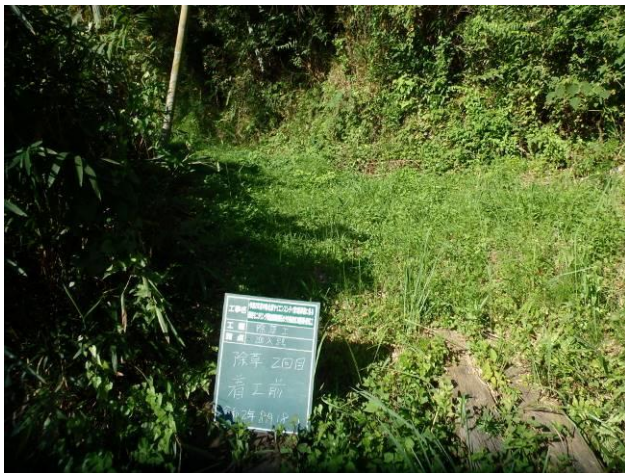
写真 4-3-22 整備状況(除草工(機械) : 除草前・保全区域A・通路 : 令和2年8月18日)