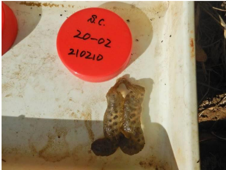
写真 4-1-7 確認した卵囊 (A-02) (令和3年2月10日)