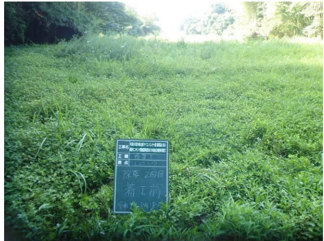
写真 4-3-13 整備状況(除草工(人力) : 除草前・ハシヨウグ 植栽地 : 令和 2 年 8 月 18 日)