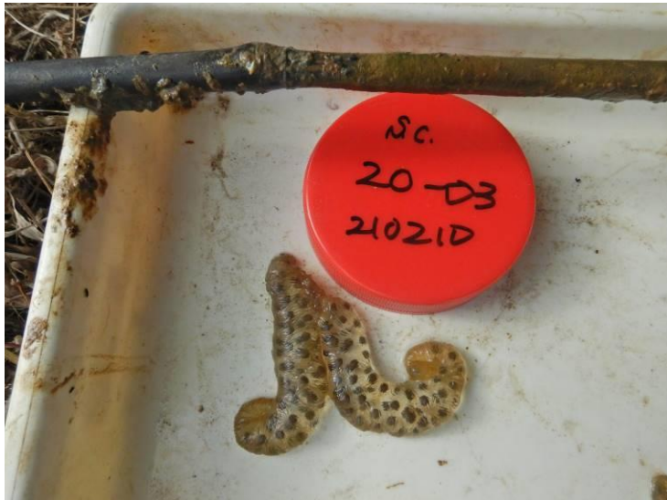
写真 4-1-8 確認した卵囊 (A-03) (令和3年2月10日)