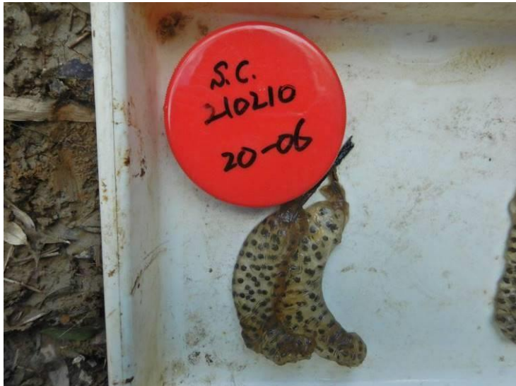
写真 4-1-11 確認した卵囊 (A-06) (令和 3 年 2 月 10 日)