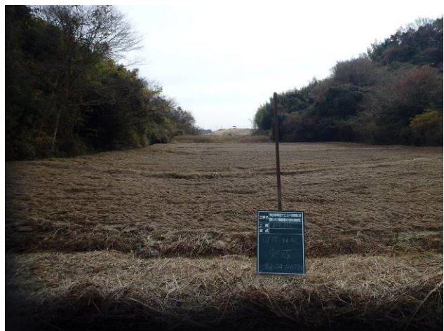
写真 4-3-33 整備状況(耕起工：耕起後・保全区域 A：令和 2 年 11 月 29 日)