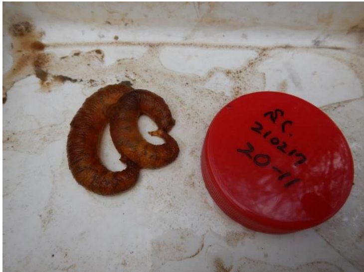
写真 4-1-16 確認した卵囊 (A-11) (令和 3 年 2 月 17 日)