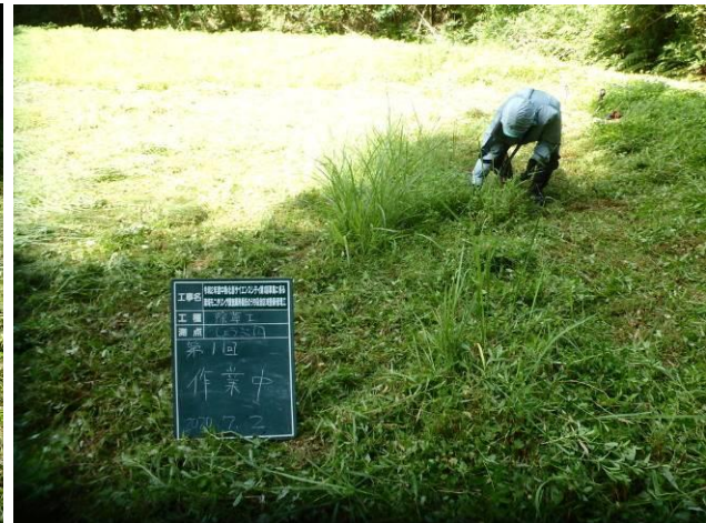
写真 4-3-11 整備状況(除草工(人力) : 除草中・ハナショウブ 植栽地 : 令和2年7月2日)