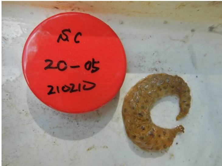
写真 4-1-10 確認した卵囊 (A-05) (令和 3 年 2 月 10 日)