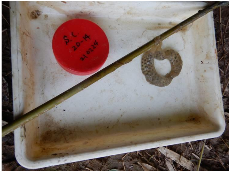
写真 4-1-19 確認した卵囊 (A-14) (令和3年2月24日)