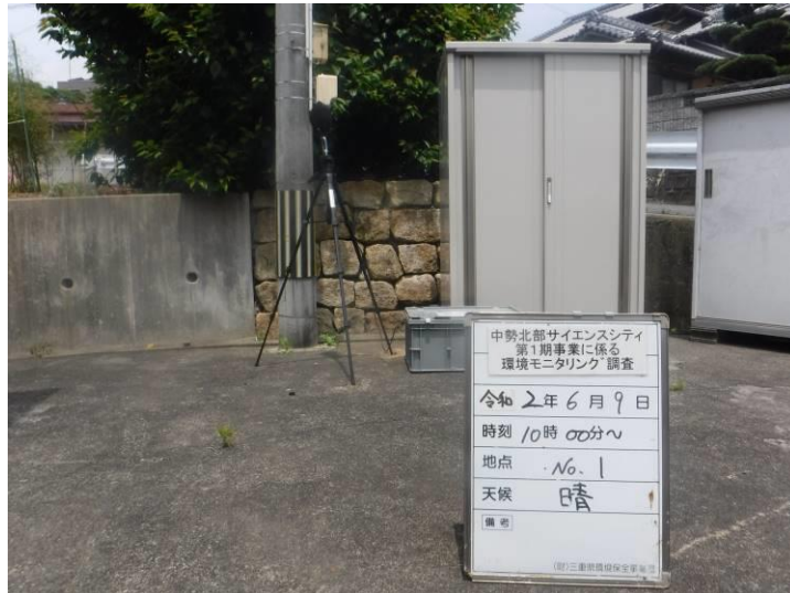
写真 4-2-1 供用後調査状況(地点No.1)(令和2年6月9日)