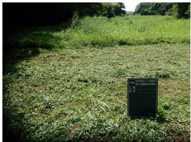
写真 4-3-15 整備状況(除草工(人力) : 除草後・ハシヨウグ 植栽地 : 令和 2 年 8 月 18 日)