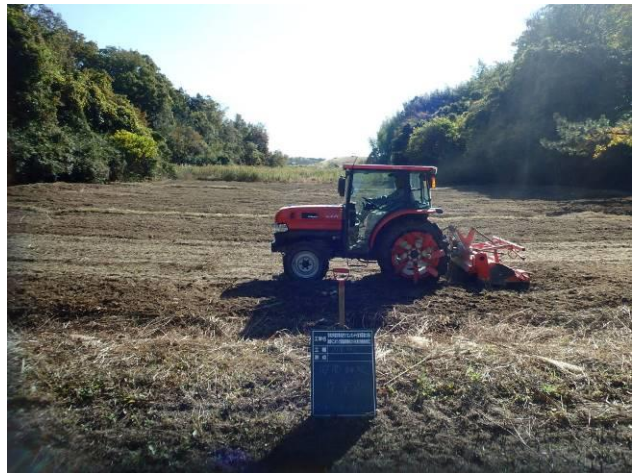
写真 4-3-32 整備状況(耕起工：耕起中・保全区域 A：令和 2 年 11 月 26 日)