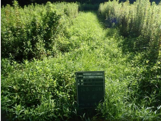
写真 4-3-4 整備状況(除草工(機械) : 除草前・保全区域 A・畦畔等 : 令和 2 年 8 月 18 日)