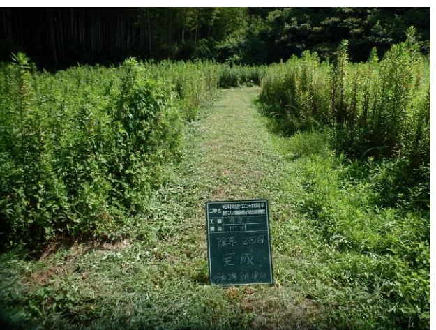
写真 4-3-6 整備状況(除草工(機械) : 除草後・保全区域 A・畦畔等 : 令和 2 年 8 月 18 日)