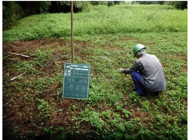
写真 4-3-14 整備状況(除草工(人力) : 除草中・ハシヨウグ 植栽地 : 令和 2 年 8 月 18 日)