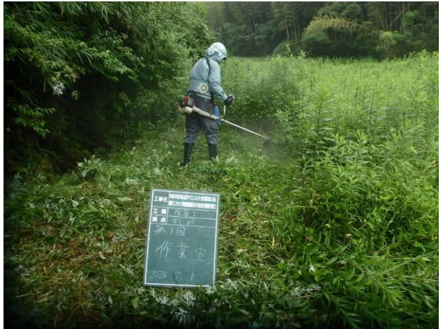
写真 4-3-2 整備状況(除草工(機械) : 除草中・保全区域A・畦畔等 : 令和2年7月1日)