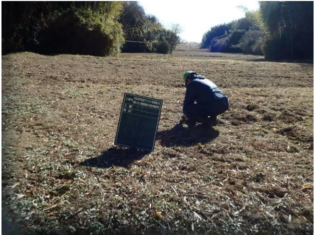
写真 4-3-17 整備状況(除草工(人力))：除草中・ハナショウブ 植栽地：令和2年11月16日