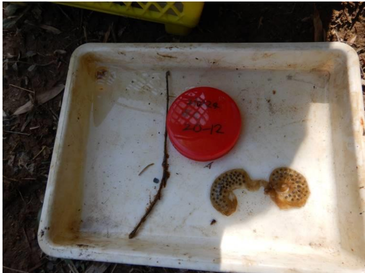
写真 4-1-17 確認した卵囊 (A-12) (令和 3 年 2 月 24 日)