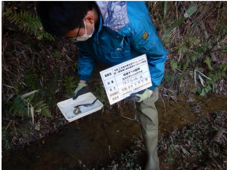
写真 4-1-4 カスミサンショウウオ調査状況（第 4 回 保全区域 A：令和 3 年 3 月 3 日）