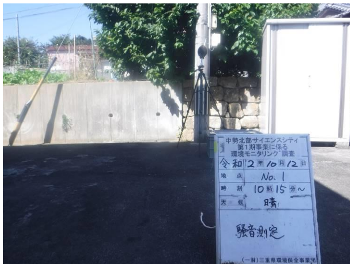
写真 4-2-3 供用後調査状況(地点No.1)(令和2年10月12日)