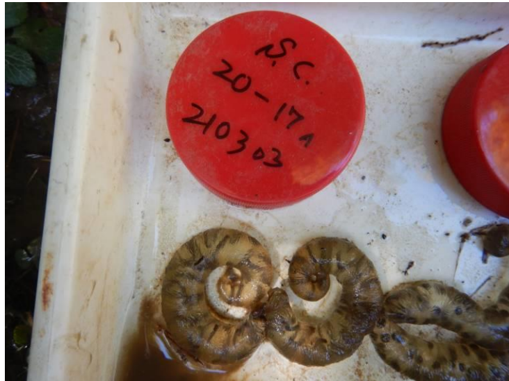
写真 4-1-22 確認した卵囊 (A-17) (令和3年3月3日)