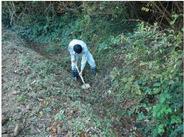
写真 4-3-35 整備状況(耕起工：耕起中・保全区域A：令和2年11月27日)