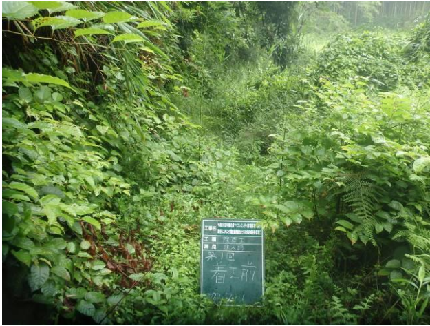
写真 4-3-19 整備状況(除草工(機械))：除草前・保全区域 A・通路：令和 2 年 7 月 1 日)