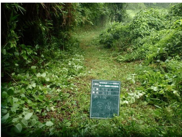
写真 4-3-21 整備状況(除草工(機械))：除草後・保全区域 A・通路：令和 2 年 7 月 1 日)