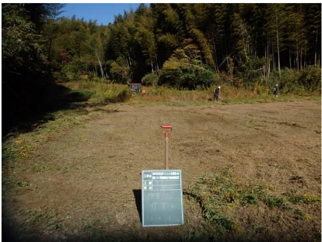
写真 4-3-29 整備状況(除草工：除草中・保全区域A・放棄水田：令和2年11月16日)