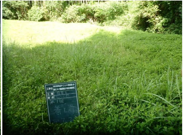
写真 4-3-10 整備状況(除草工(人力) : 除草前・ハナショウブ 植栽地 : 令和2年7月2日)