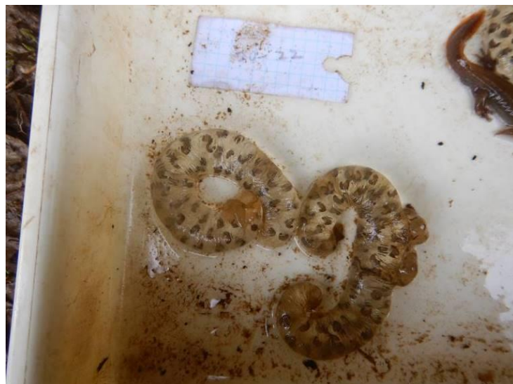
写真 4-1-27 確認した卵囊 (A-22) (令和3年3月8日)