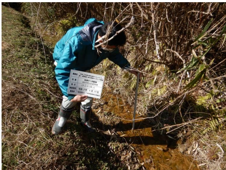
写真 4-1-3 カスミサンショウウオ調査状況（第3回 保全区域A：令和3年2月24日）