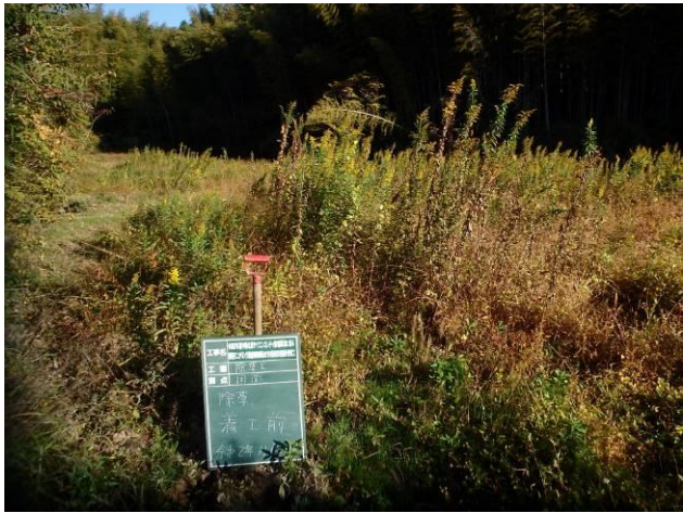
写真 4-3-28 整備状況(除草工：除草前・保全区域A・放棄水田：令和2年11月16日)