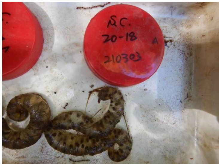
写真 4-1-23 確認した卵囊 (A-18) (令和3年3月3日)