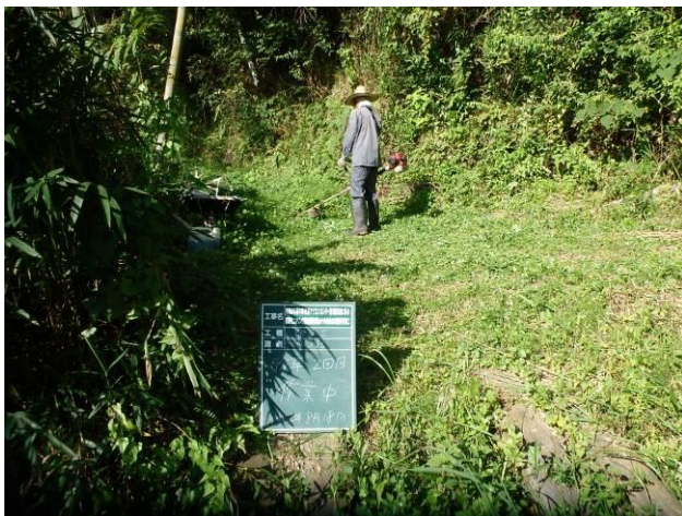
写真 4-3-23 整備状況(除草工(機械) : 除草中・保全区域A・通路 : 令和2年8月18日)