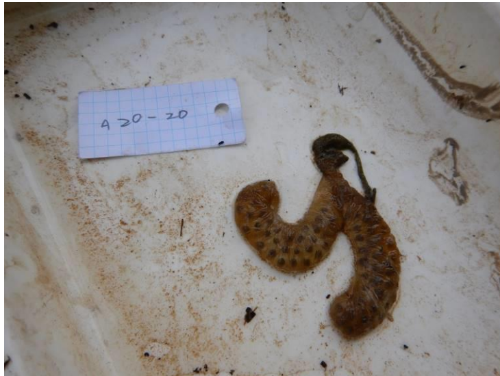
写真 4-1-25 確認した卵囊 (A-20) (令和3年3月8日)