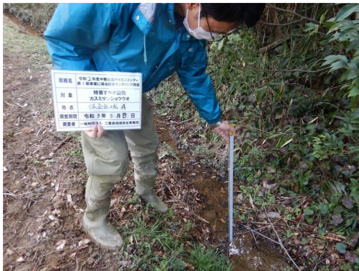
写真 4-1-5 カスミサンショウウオ調査状況（第 5 回 保全区域 A：令和 3 年 3 月 8 日）