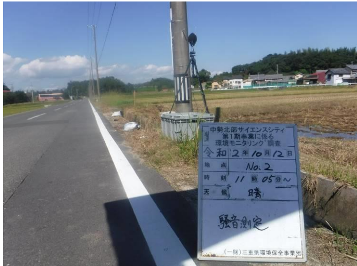
写真 4-2-4 供用後調査状況(地点No.2)(令和2年10月12日)