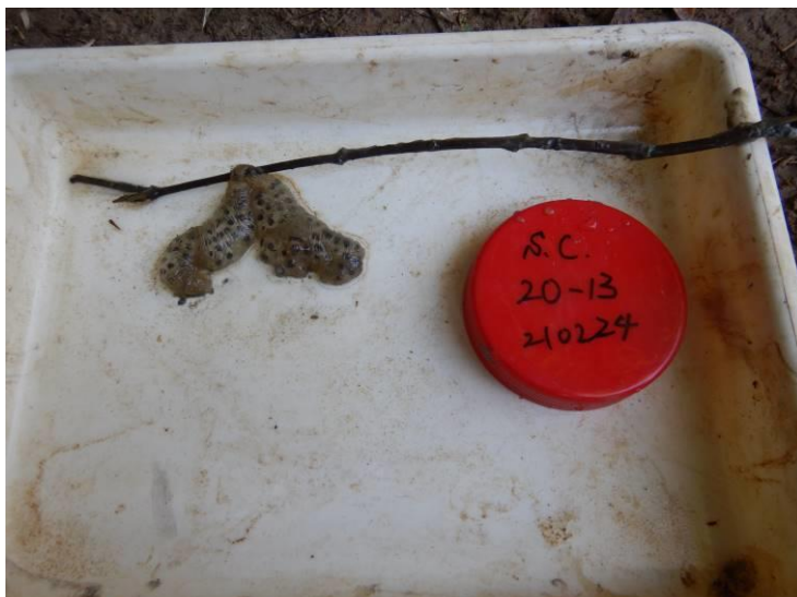
写真 4-1-18 確認した卵囊 (A-13) (令和 3 年 2 月 24 日)