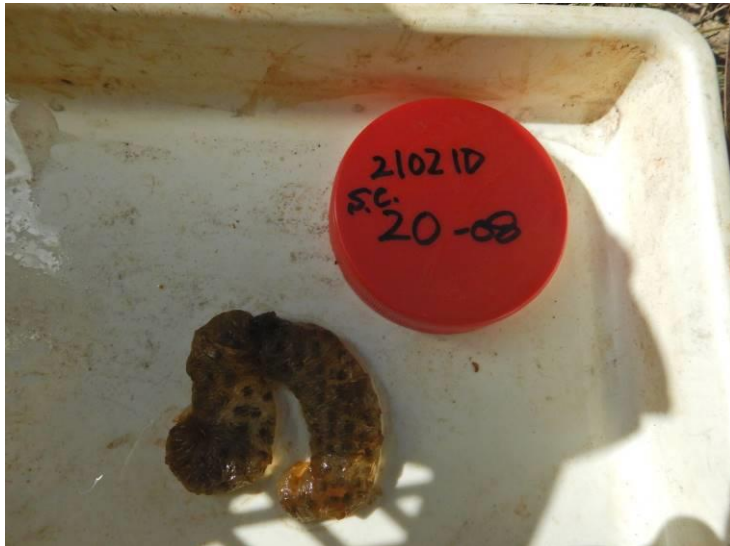
写真 4-1-13 確認した卵囊 (A-08) (令和 3 年 2 月 10 日)