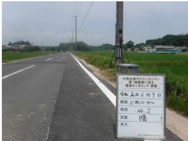
写真 4-2-2 供用後調査状況(地点No.2)(令和2年6月9日)