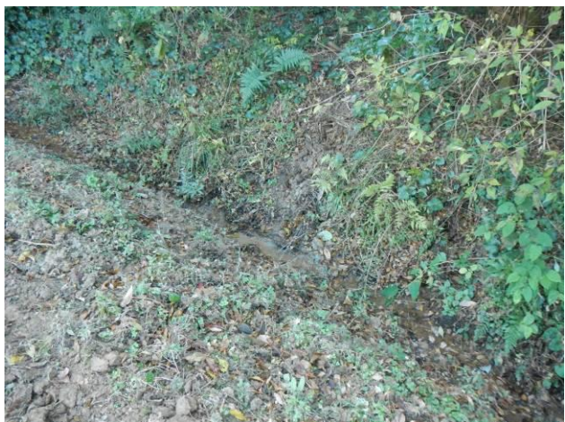
写真 4-3-36 整備状況(耕起工：耕起後・保全区域A：令和2年11月29日)