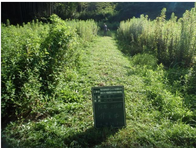
写真 4-3-5 整備状況(除草工(機械) : 除草中・保全区域 A・畦畔等 : 令和 2 年 8 月 18 日)