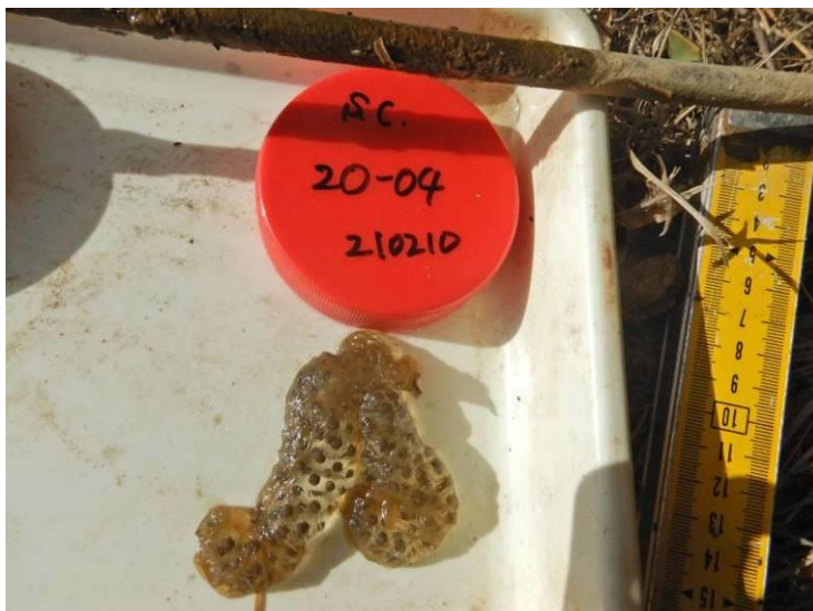
写真 4-1-9 確認した卵囊 (A-04) (令和3年2月10日)