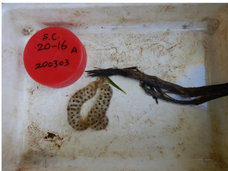
写真 4-1-21 確認した卵囊 (A-16) (令和3年3月3日)