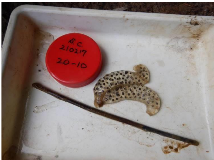
写真 4-1-15 確認した卵囊 (A-10) (令和 3 年 2 月 17 日)