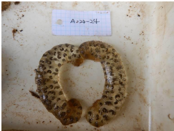
写真 4-1-29 確認した卵囊 (A-24) (令和3年3月8日)