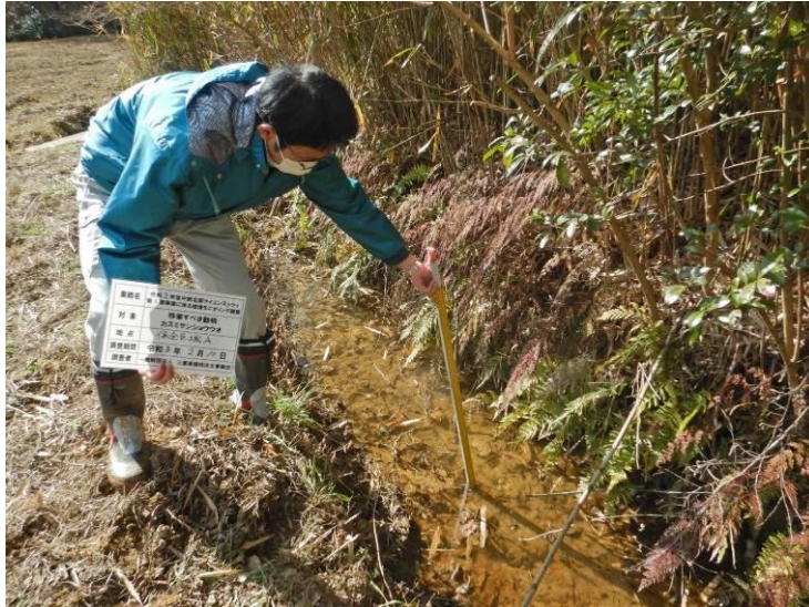
写真 4-1-1 カスミサンショウウオ調査状況（第1回 保全区域A：令和3年2月10日）