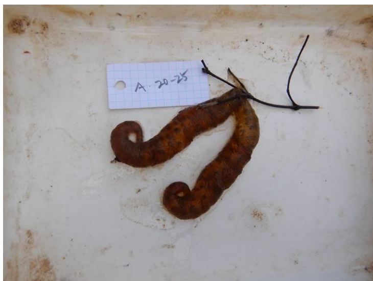
写真 4-1-30 確認した卵囊 (A-25) (令和3年3月8日)