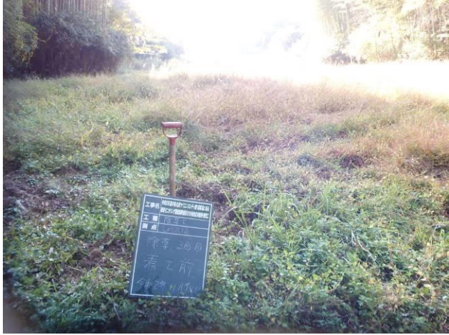
写真 4-3-16 整備状況(除草工(人力))：除草前・ハナショウブ 植栽地：令和2年11月14日