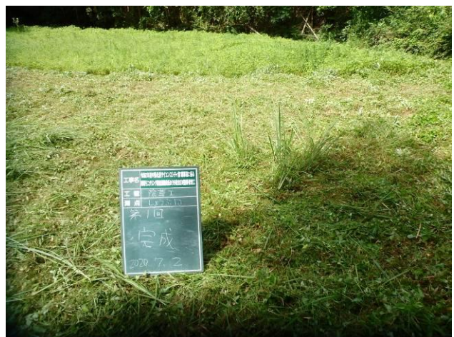
写真 4-3-12 整備状況(除草工(人力) : 除草後・ハナショウブ 植栽地 : 令和2年7月2日)