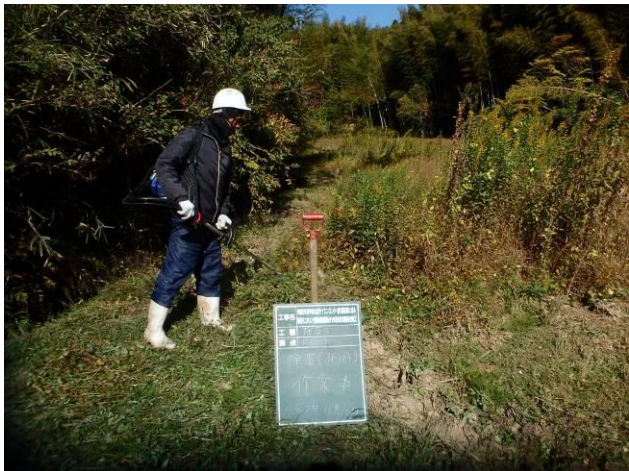
写真 4-3-8 整備状況(除草工(機械))：除草中・保全区域A・畦畔等：令和2年11月16日)