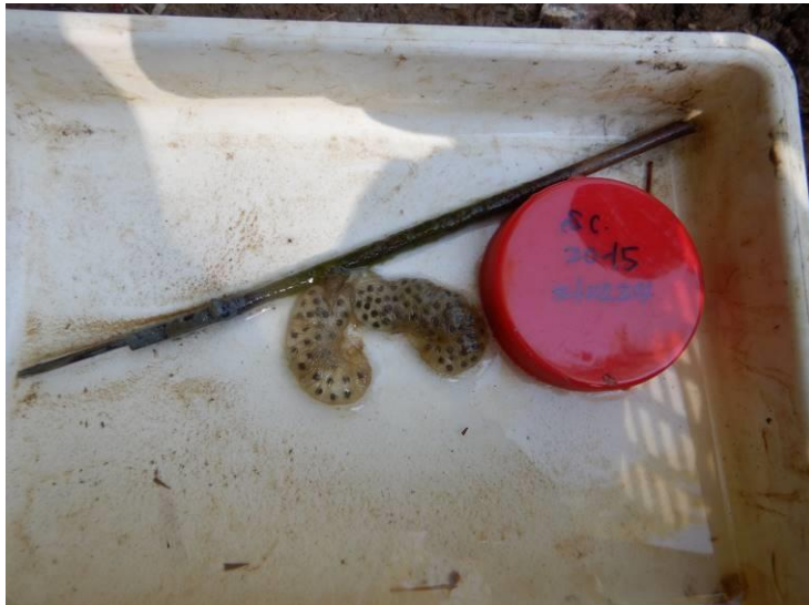
写真 4-1-20 確認した卵囊 (A-15) (令和3年2月24日)