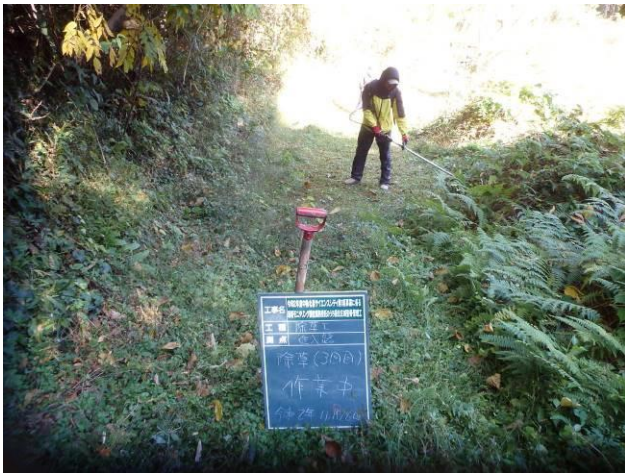
写真 4-3-26 整備状況(除草工：除草中・保全区域A・通路：令和2年11月16日)