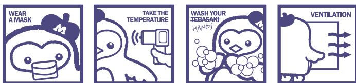
マスク着用 検温 手洗い・消毒 換気

三重県のガイドラインにおける「主催イベントの開催基準」に則って開催します。感染症対策については、ご来館前にフレンテみえホームページをご確認ください。今後の感染拡大状況により、日程・会場の変更や「オンライン」での実施、または講座が中止となる場合がございます。開催情報に変更があった際、お申込のみなさまには個別にご連絡いたします。最新の情報は、フレンテみえホームページにて随時ご案内いたします。