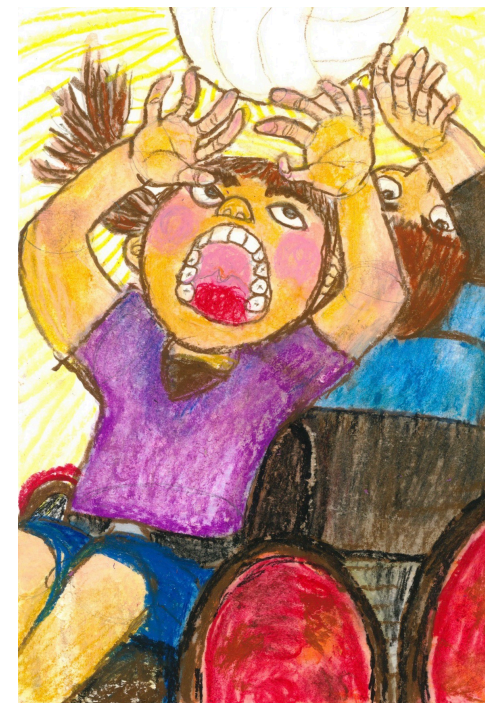
出典：公益財団法人 日本障がい者スポーツ協会 日本パラリンピック委員会「すごいぞ！パラリンピック」 絵画・作文コンクール https://www.asagaku.com/paralympic/index.html

https://www.jsad.or.jp/paralympic/sports/index_summer.html