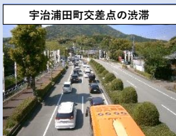
伊勢ICから市営駐車場までの所要時間