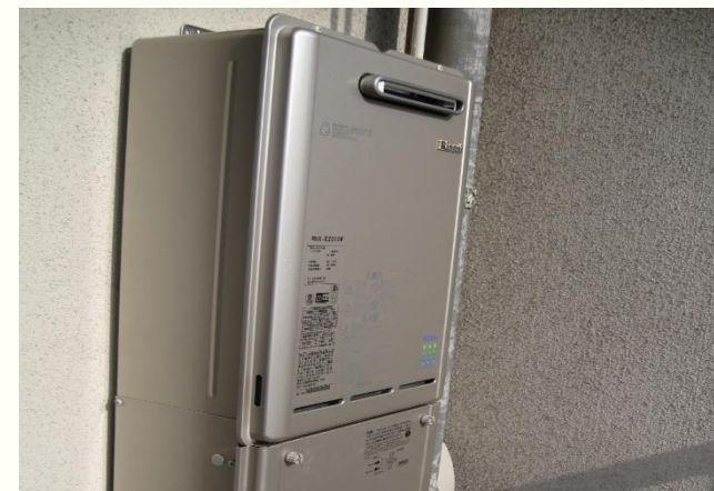
給湯機設置 (台所、浴室へ供給)