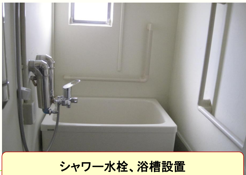
シャワー水栓、浴槽設置