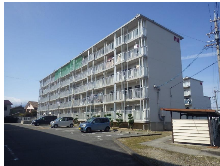
外壁塗装 改修 後