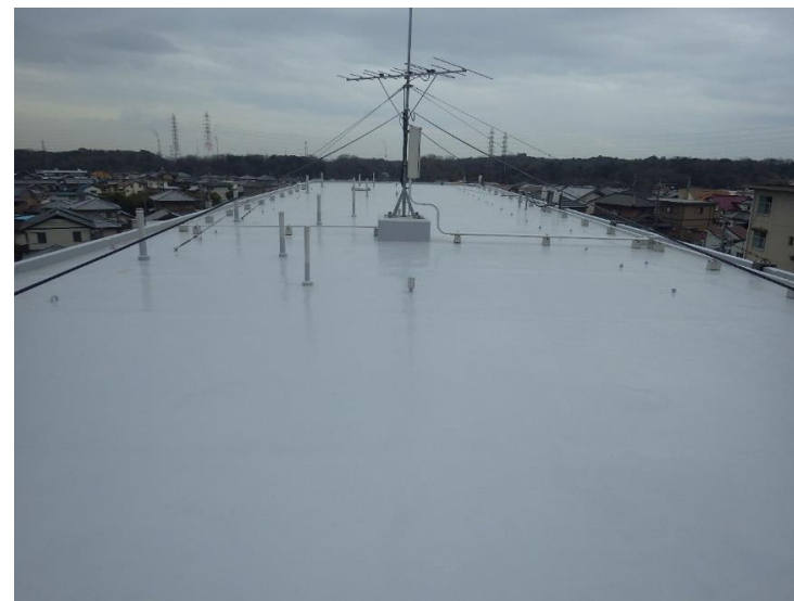
屋上防水 改修 後