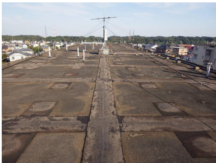
屋上防水 改修 前