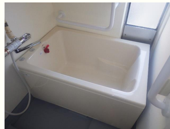
シャワー水栓、浴槽設置