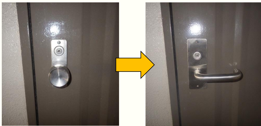
取手のレバーハンドル化