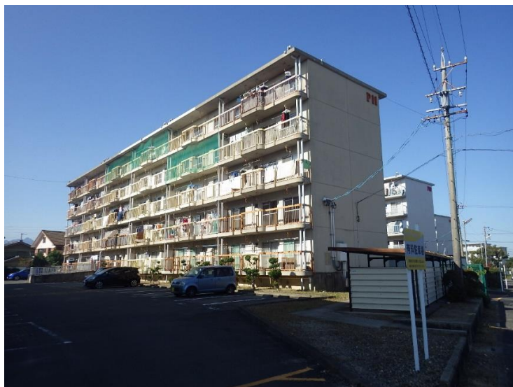
外壁塗装 改修 前