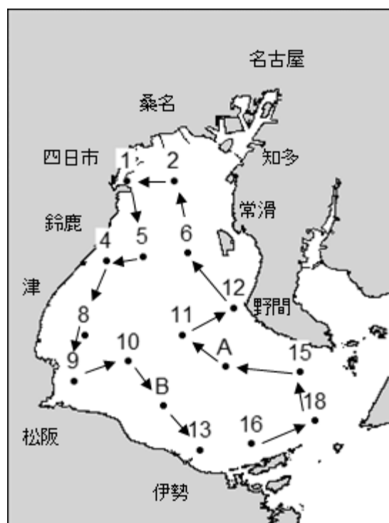
浅海定線観測点及び航跡図

平年値+2.5以上 : かなり高め 平年値+1.5～2.5 : 高め 平年値+0.5～1.5 : やや高め 平年値±0.5 : 平年並 平年値-0.5～1.5 : やや低め 平年値-1.5～2.5 : 低め 平年値-2.5以上 : かなり低め 単位は水温が℃、塩分が PSU、DO が mg/L