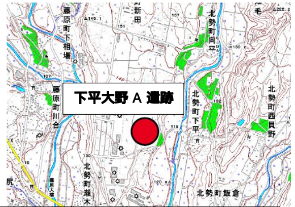
調査地位置図(国土地理院 1:25,000 『駒野』より)