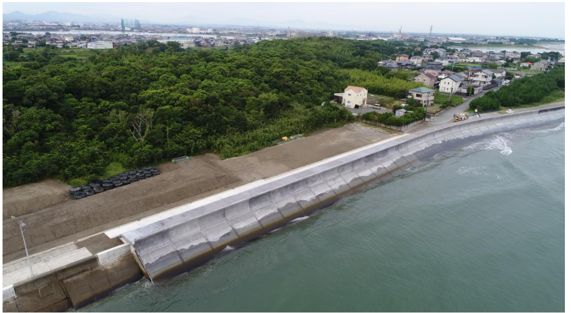
一部完成状況(今一色工区)