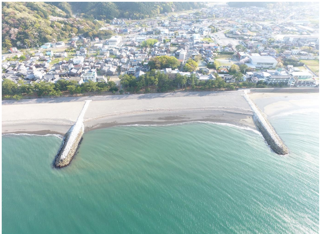
一部完成状況(茶屋工区)