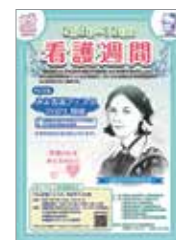
みえ看護フェスタ2021ポスター