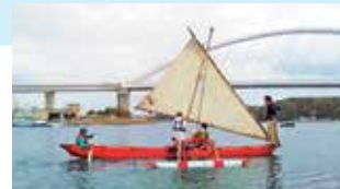
試験的な進水が行われたようです。カヌーには、大木をくりぬいて作る伝統的な工法が用いられています。

しかし、経年により、ひび割れなどが生じ、現在は安全な操船がかなわない状態です。この節目に友好のカヌーを修繕し、水産高校の生徒たちの操船体験や航海知識・技術の向上、パラオ高校とのオンライン交流に活用したいと考えています。パラオとの絆を次世代につないでいくため、皆さんの温かいご支援をお願いします。