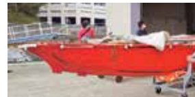
カヌーは応急的に修繕されていますが、水に浮かべると水がしみ込むため、抜本的な修繕が必要です。