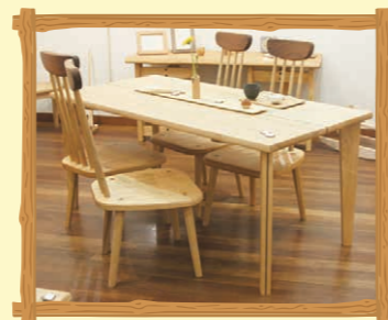
ダイニングテーブル