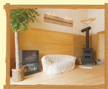
壁・床などの内装

三重県では、三重県産の木材を使用した家具、小物等を紹介する冊子を発行しています。