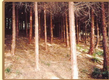
荒れて、不健康な森林