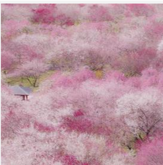
いなべ農業公園（いなべ市）tomyjam36 様