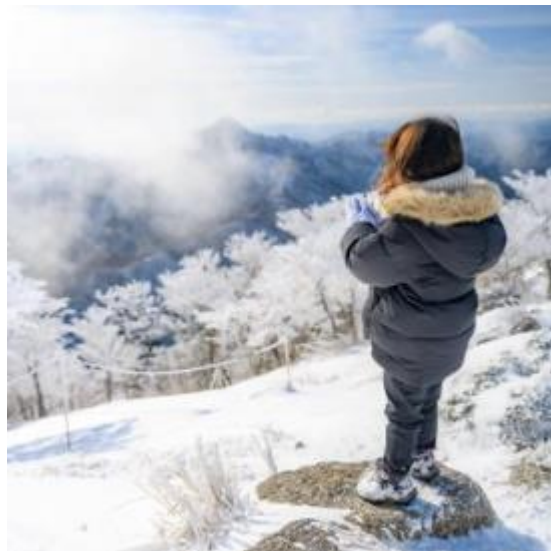
御在所岳（菰野町） kyasunobu 様