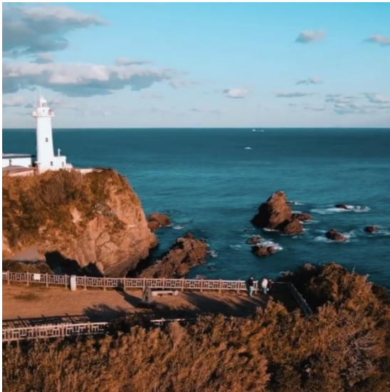
大王崎灯台（志摩市） y_bruno. y_様