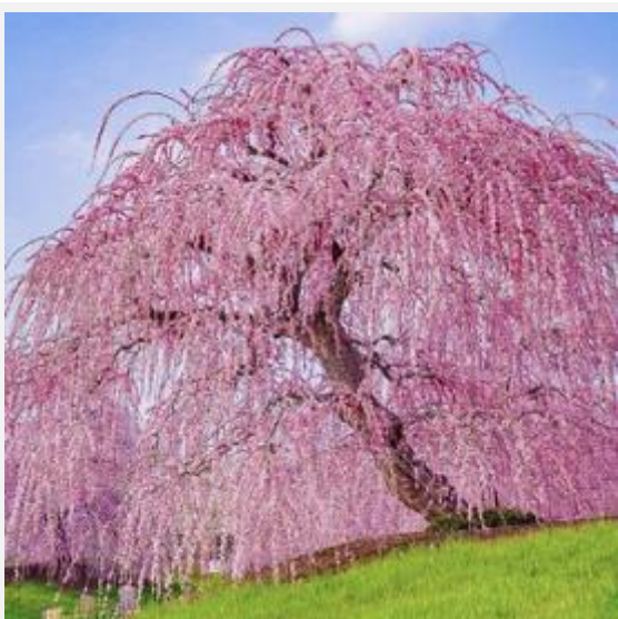
鈴鹿の森庭園（鈴鹿市）tomyjam36 様