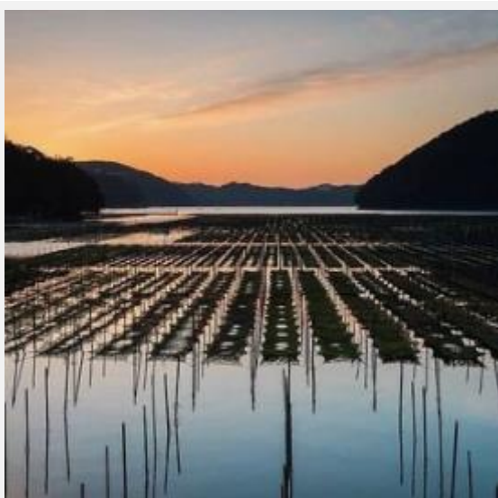
あおさ養殖場（南伊勢町） kuroneko1717 様