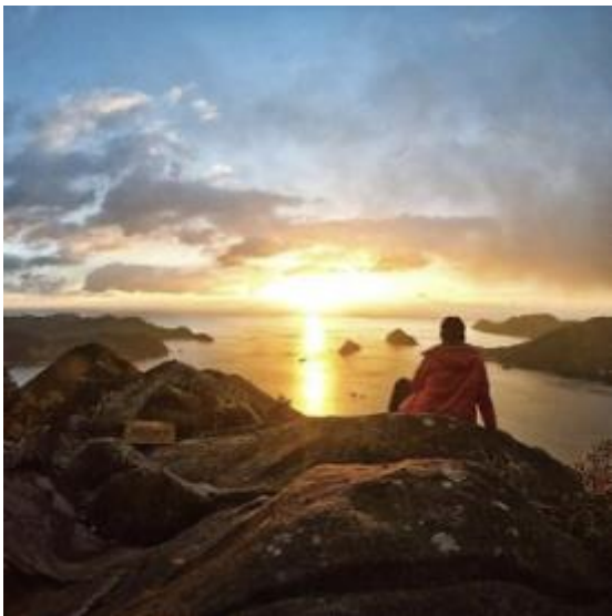
おちよぼ岩（尾鷲市）tatsuya_yoshikawa 様