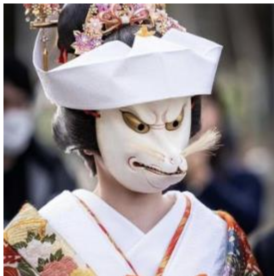
海山道神社（四日市） benjaminbeech 様