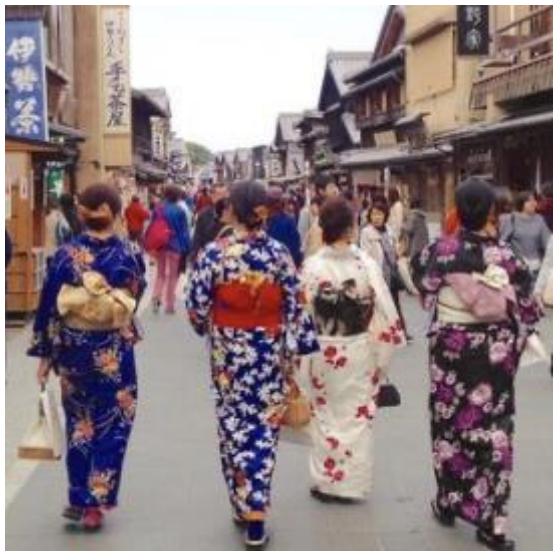
おかげ横丁（伊勢市） hanazukisan 様