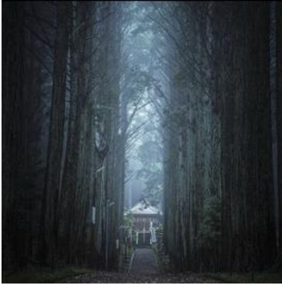
尾高観音（菰野町）na.gayoshi 様