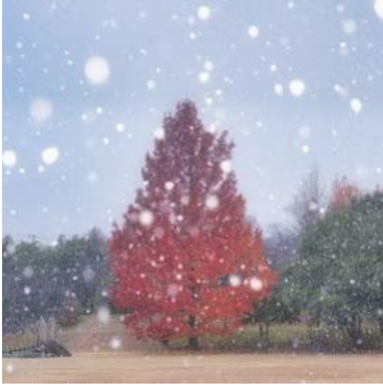
三重県民の森（菰野町） y. campanella 様