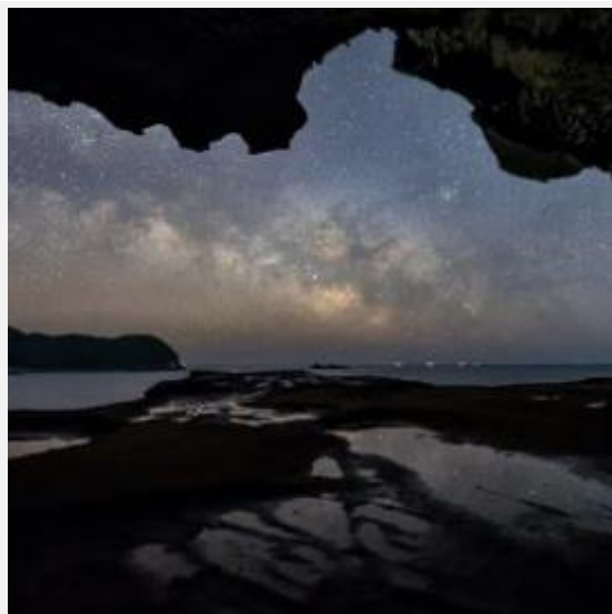
鬼が城（熊野市） kuroneko1717 様