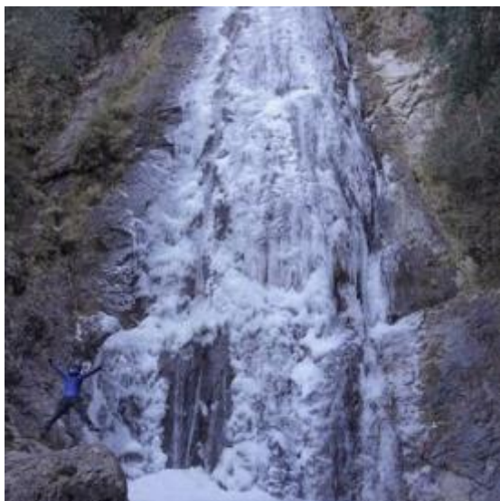
清五郎滝（紀北町） atsushinakano 様