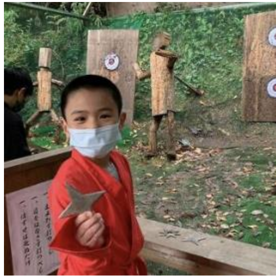
赤目忍者修行（名張市）superdjt看 様