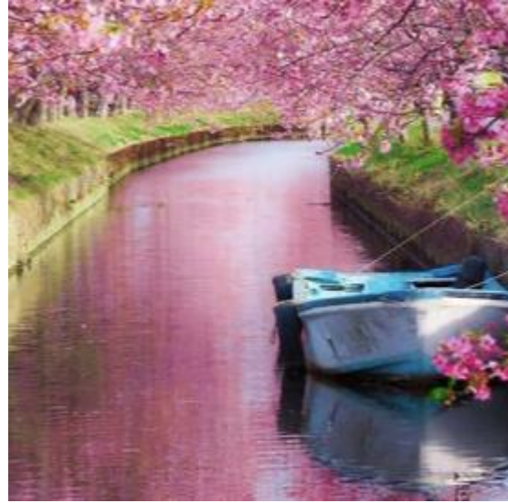
笠松河津桜ロード（松阪市） yu. _ . yummm 様