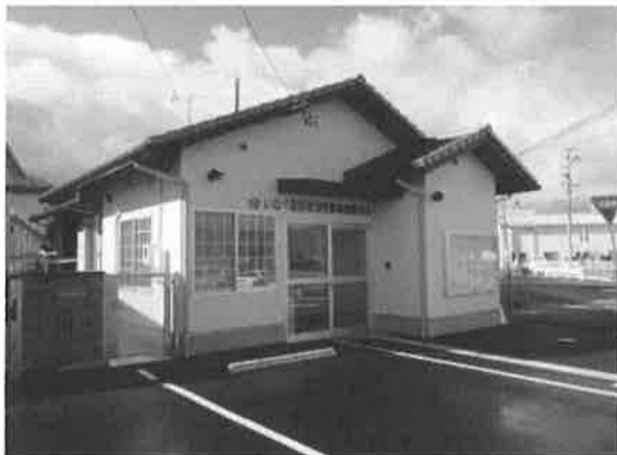
いなべ警察署治田駐在所

○独身者・単身者の配置が多い現状を踏まえ、令和2年度から居住スペースを縮小した1LDK仕様のコンパクト駐在所を導入し、費用の縮減と狭小敷地での建て替えを実現しました。引き続き、セキュリティの強化や来訪住民のプライバシーの確保、快適性の向上、バリアフリー化、居住家族の暮らしやすさの向上を図ります。