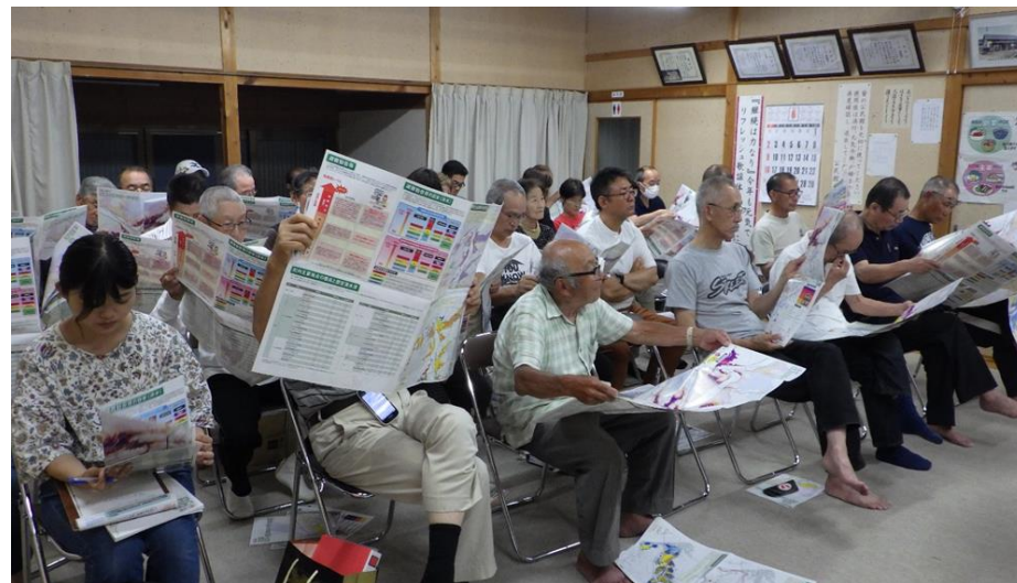
洪水ハザードマップを活用した防災学習会