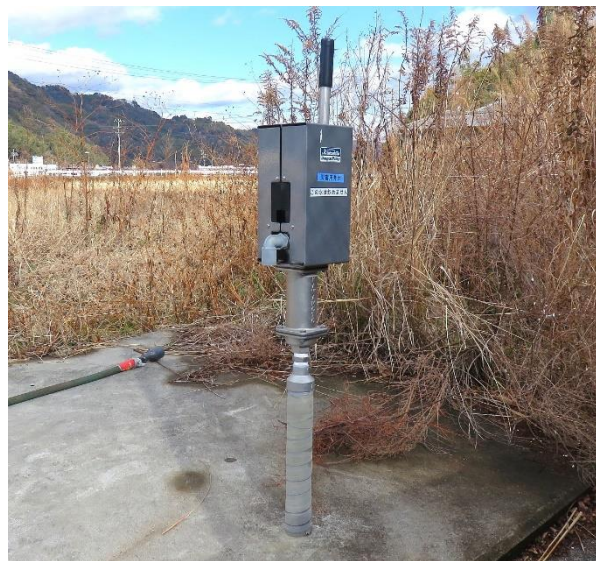
手押しポンプ2箇所