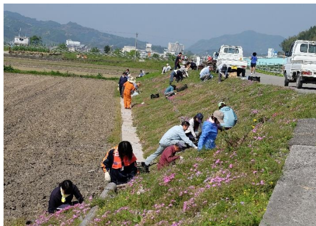
地域の花街道を整備