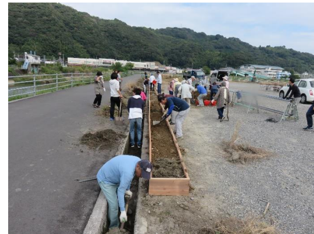
地域の広場を整備