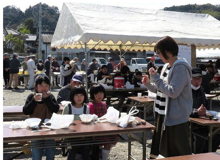
世代間を越えた交流が、防災活動の活性化へ