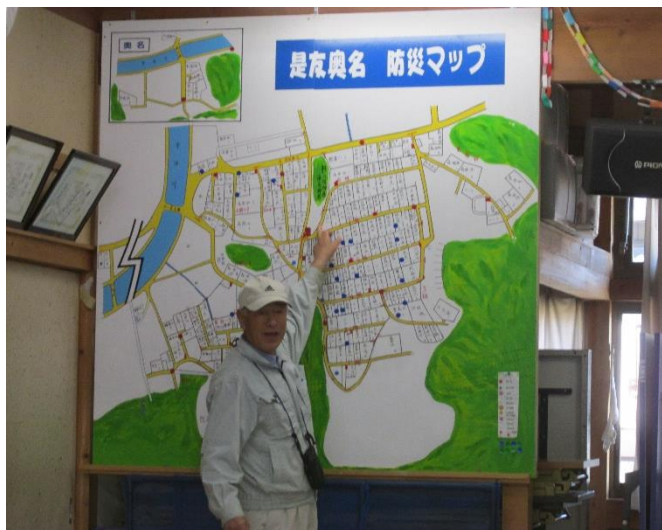
防災マップの確認