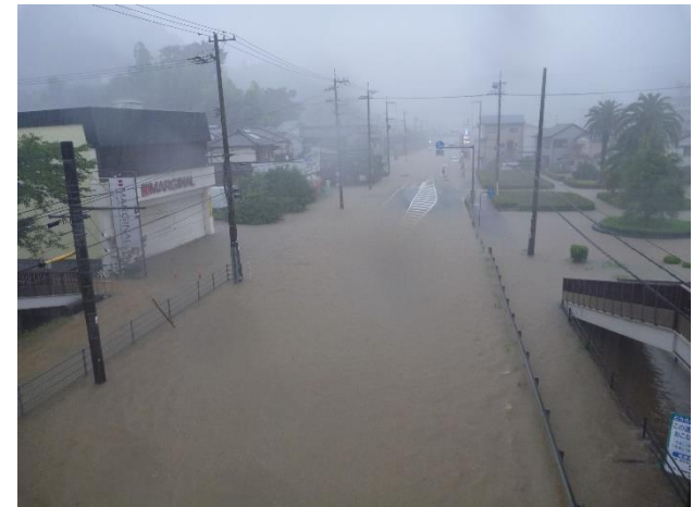
国道33号や電車軌道も冠水