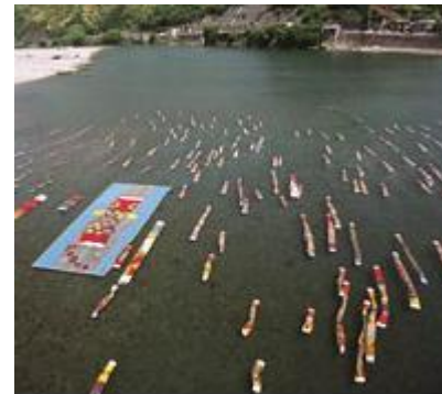
仁淀川紙のこいのぼり