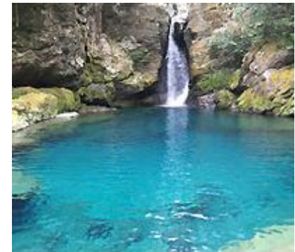
奇跡の清流仁淀川の「仁淀ブルー」