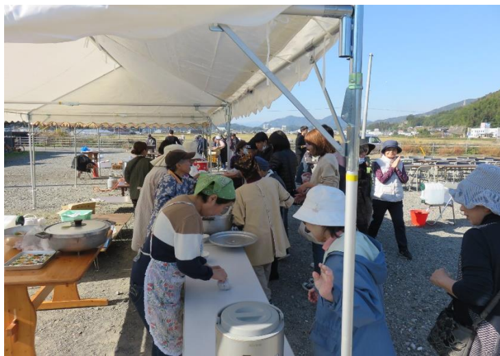
地域行事に併せて炊き出し訓練も実施