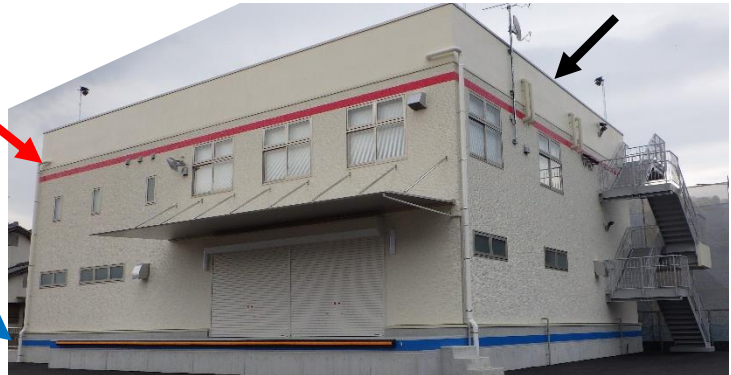
令和元年 町が整備した防災備蓄倉庫兼避難所