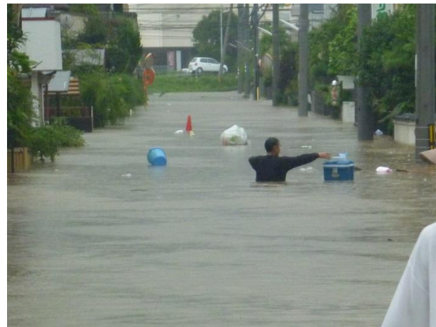
住宅地では胸元まで浸水