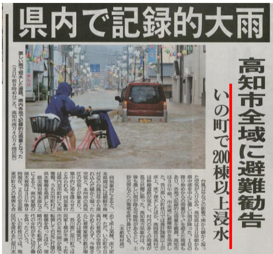
浸水被害が新聞で伝えられる