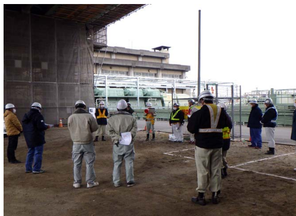
工事関係者による説明