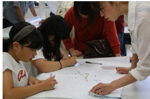
平成28年度防災マップづくりの様子