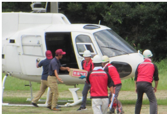
ヘリコプターを使った訓練の様子