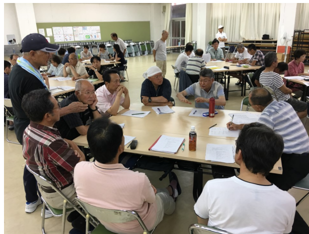
過去の防災人材育成研修会(総務班)