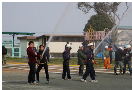
過去の防災訓練での地震体験車、消火器使用体験の様子