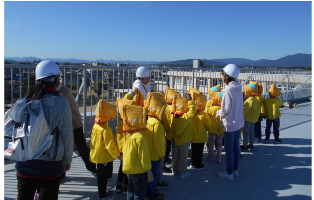
津波避難訓練の様子