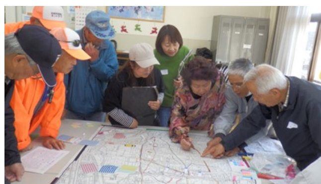
令和元年度 タウンウォッチングの様子