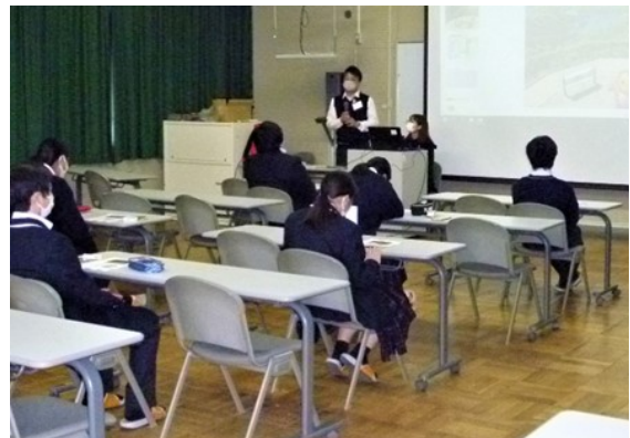
南伊勢町防災安全課の講義の様子

本校と同様に、地域との連携・協働により、独自の取組をしている団体の活動例を知り、参考にさせていただきたいです。