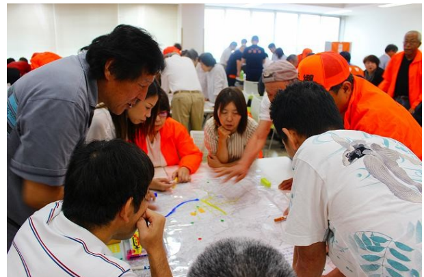
過去のワークショップの様子