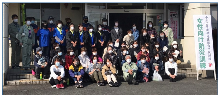
女性向け防災訓練