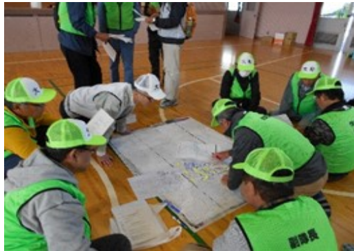
令和元年度 災害図上訓練の様子