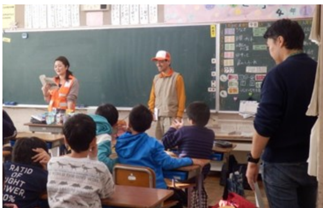
令和元年度 井田川小学校 「防災クラブ」の様子

一過性のイベントではなく、 地道にコツコツ活動することが大切です。 「初心を忘れずに」をモットーに！！