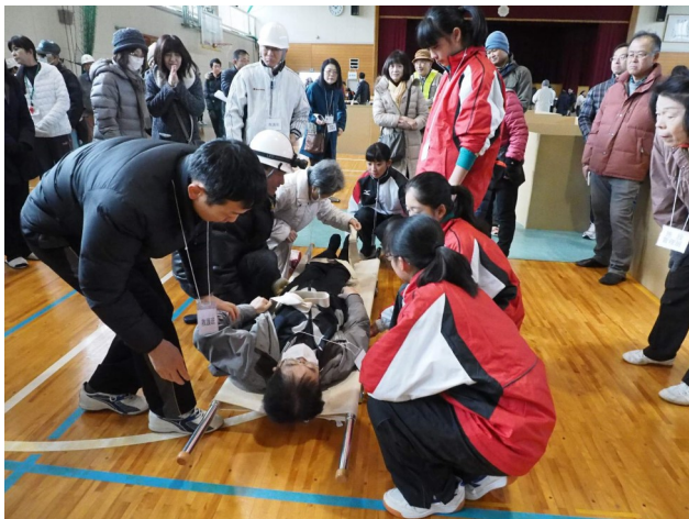
過去の訓練の様子

防災活動は自助が基本です。行政に任せきりにせず、 自分たちの命は自分たちで守るという意識付けがスタートの基本 となります。