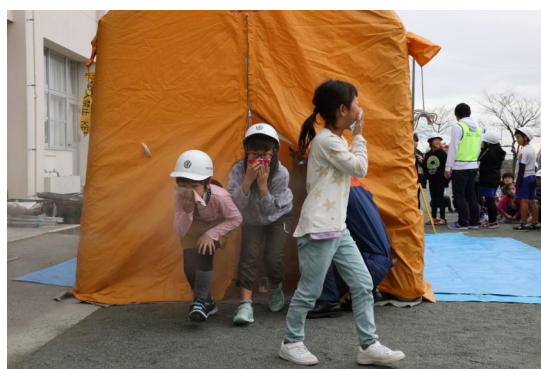
過去の防災訓練での消火器使用訓練、煙体験の様子