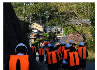
津波避難訓練の様子

火災避難訓練では、全校生徒・教職員が連携し、安全・迅速な団体行動での避難訓練、消防団の指導による初期消火の訓練を行い、津波避難訓練では、震度6強の地震発生、さらには大津波警報が発表される状況を想定し、本校が設定している1次避難場所への避難訓練を実施しました。