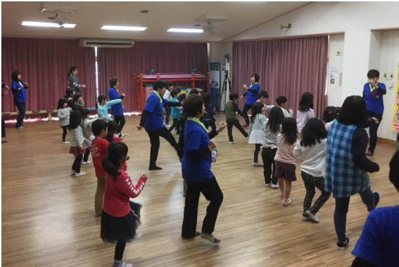
「防災体操あいうえお」

普通のおばちゃんが、自らの災害への備えを防災講座で学び続けるうちに、「自分ひとりの力だけでは乗り越えられない、公助も不安、じゃあ地域力だ!」と気づき、周りの人に伝えると仲間が集まり、一人ではできないこともみんなで考え、教室を開催してみると、色んな方法で防災について伝えることができるとわかりました。 気負わず、楽しく、それが自主的な防災活動 だと思います。