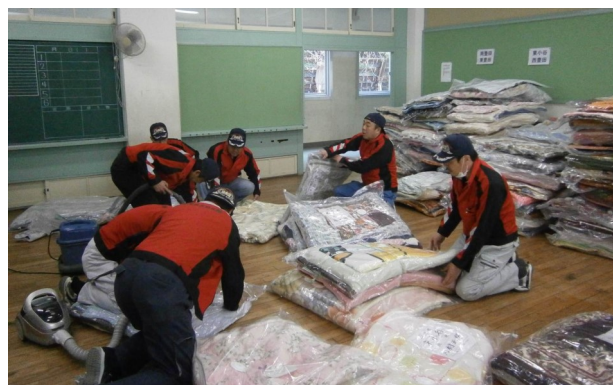
備蓄毛布等の衛生点検の様子