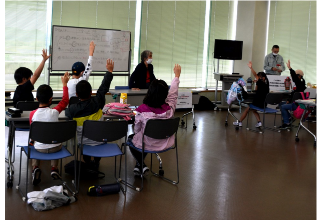
「秋の子ども防災サミット」の様子(ストローハウス作りと避難所の講義)