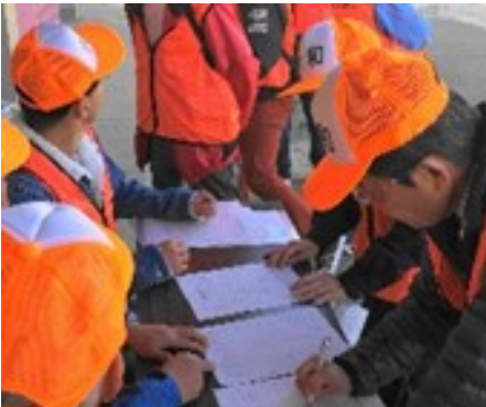
令和元年度 避難所運営訓練の様子