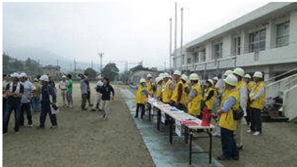
平成28年度合同防災訓練の様子

多分、同じような悩みや問題点をお持ちのことと思います。 市町や府県の枠を超えた連携で解決できることもあり、私たちが勉強になるので、話し合える機会があると良いですね。