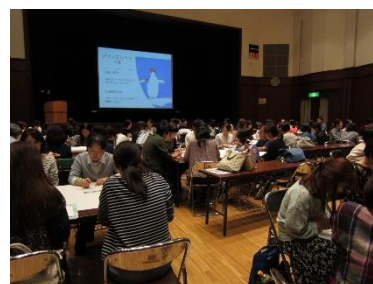
糖尿病重症化予防人材育成研修会 (グループワーク)