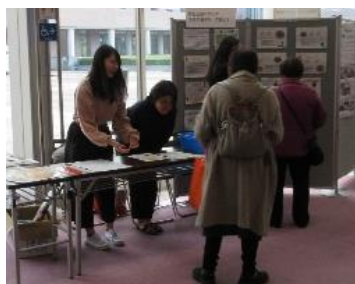
学生による減塩啓発