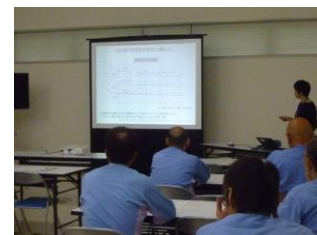
管内事業所にて健康教育