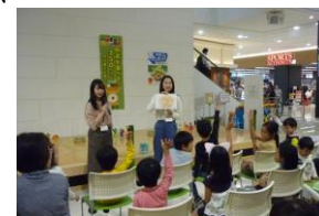
イオンモール東員の食育フェス