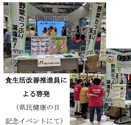
食生活改善推進員による啓発