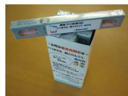
歯と口の健康週間歯ブラシ

歯と口の健康週間に合わせて、イベントや飲食店に通じて歯ブラシ、歯の健康に関するリーフレットの配布を行います。