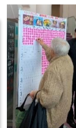
参加者投票による グランプリ決定