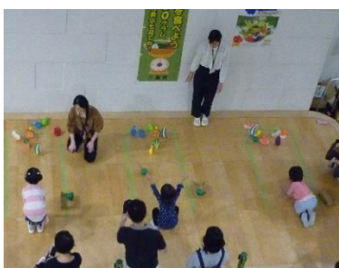
大学と連携した食育啓発