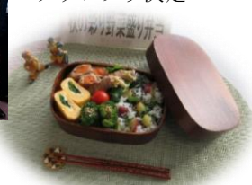
健康野菜たっぷり料理コンクール