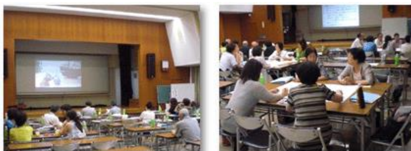
サポーター研修会の様子