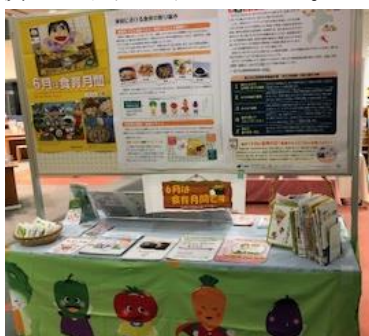
県立図書館とのコラボ啓発