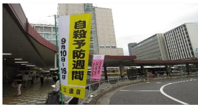
自殺予防週間街頭啓発