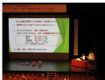
入賞者によるプレゼンテーション