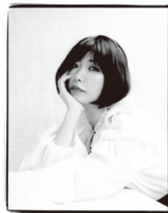
YUTO KUDO: Madame Figaro Japon

大阪府生まれ。2007年、デビュー小説『わたくし率イン 齒一、または世界』が第137回芥川賞候補に。同年、第1回早稲田大学坪内逍遙大賞奨励賞受賞。2008年、『乳と卵』で第138回芥川賞を受賞。2009年、詩集『先端で、さすわ さされるわ そらええわ』で第14回中原中也賞受賞。2010年、『ヘヴン』で平成21年度芸術選奨文部科学大臣新人賞、第20回紫式部文学賞受賞。2013年、詩集『水瓶』で第43回高見順賞受賞。短編集『愛の夢とか』で第49回谷崎潤一郎賞受賞。2016年、『あこがれ』で渡辺淳一文学賞受賞。「マリーの愛の証明」にてGranta Best of Young Japanese Novelists 2016に選出。他に『すべて真夜中の恋人たち』や村上春樹との共著『みみずくは黄昏に飛びたつ』、短編集『ウィステリアと三人の女たち』など著書多数。『早稲田文学増刊 女性号』では責任編集を務めた。最新刊の長編『夏物語』は、2020年4月に『Breasts and Eggs』(Europa Editions)として英訳が刊行され、25か国以上で翻訳が進む。