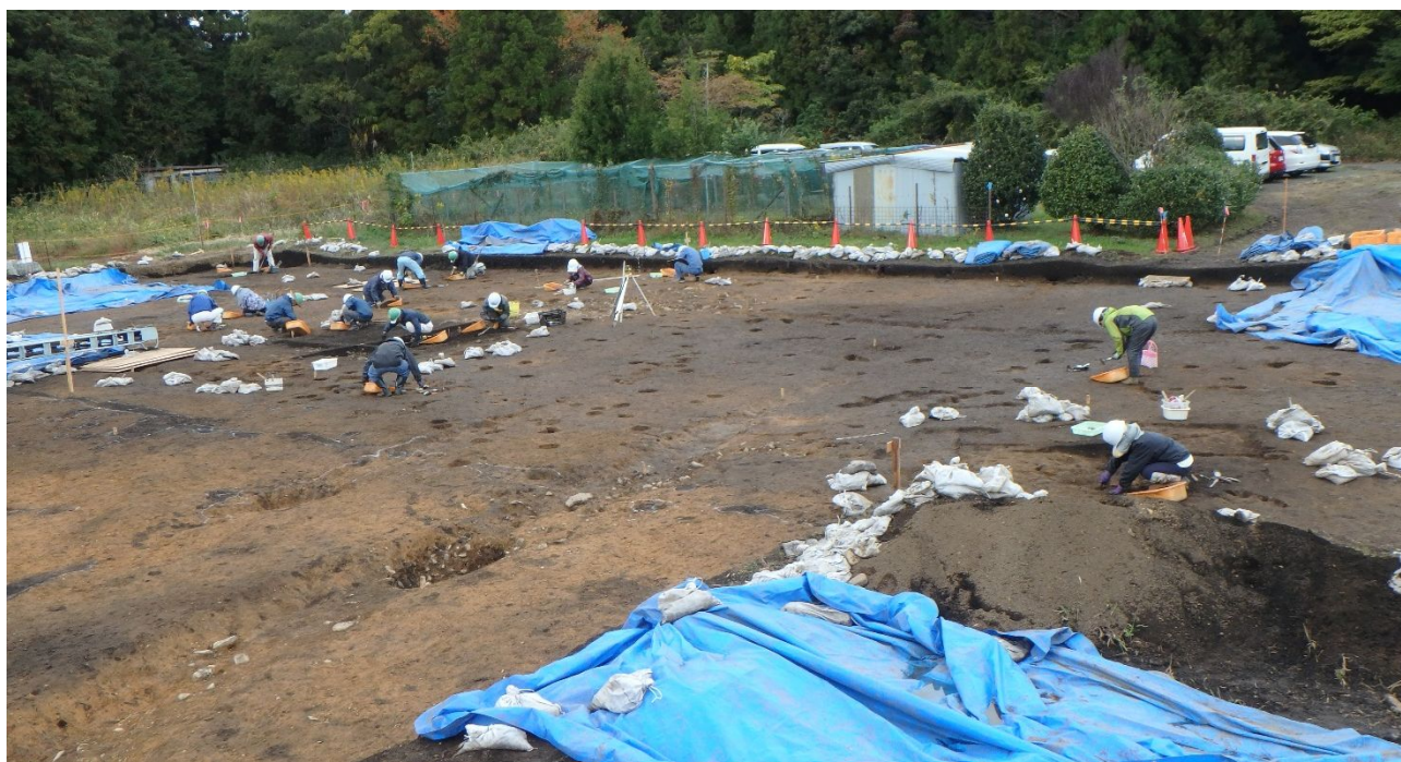
作業のようす（南東から撮影）

遺構検出・掘削を進めています。調査区北西部に竪穴建物が4棟、掘立柱建物が2棟見つかりました。また竪穴建物・掘立柱建物から弥生時代の土器の欠片が出土しています。今後の成果に、ご期待ください。