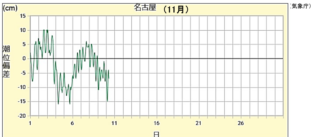
【名古屋港の潮位偏差(速報値)】

潮位偏差: 計算上の予測潮位と実測潮位との差 プラスの時は実際の潮位が予想潮位より高く、マイナスの時は低いことを示す。