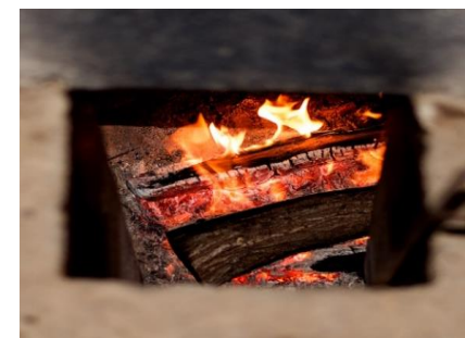
燻す際の燃料として三重県産ウバメガシを使用しています