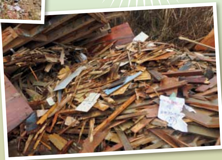
三重県における廃棄物の不法投棄件数等