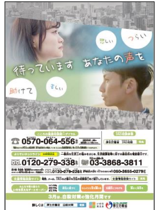
令和元年度 自殺対策強化月間ポスター

三重県では平成10年に自殺者が急増以来11年連続して年間400人前後でした。平成22年以降減少傾向にありますが、年により増減を認め、平成30年は年間293人の方が亡くなられています。