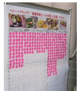
参加者による投票