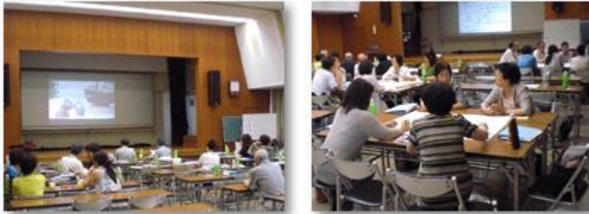
サポーター研修会の様子