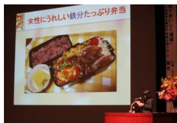
高校生によるプレゼンテーション