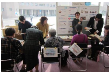
学生による減塩啓発