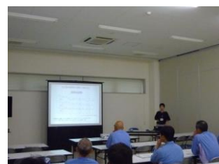
管内事業所にて健康教育