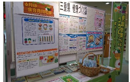
県立図書館とのコラボ啓発

(2) みえの食フォーラム（三重県栄養改善大会）を開催し、「食」と「運動」をテーマに野菜フルや食塩エコの取組を含め、食育関係者、県民が共に考える場を提供しました。