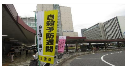
自殺予防週間街頭啓発