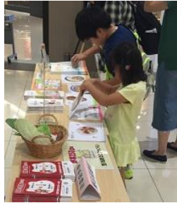
料理の中の野菜あてクイズ