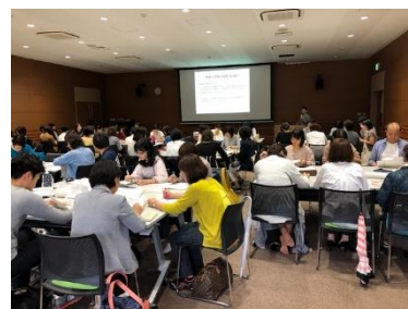
糖尿病重症化予防人材育成研修会