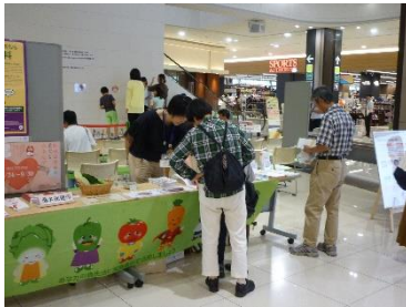
イオンモール東員の食育フェス

(1) バランスのとれた食事をはじめ、野菜摂取や減塩を推進するため多様な主体と連携した啓発を行いました。