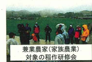
兼業農家(家族農業) 対象の稲作研修会