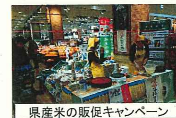
県産米の販促キャンペーン