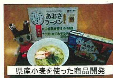
県産小麦を使った商品開発