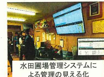
水田圃場管理システムに よる管理の見える化