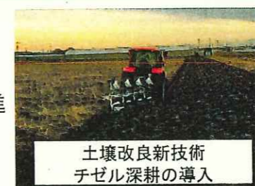
土壤改良新技術 チゼル深耕の導入