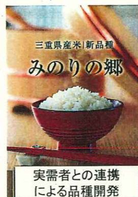
三重県産米|新品種 みのりの郷 実需者との連携 による品種開発