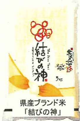
県産ブランド米 「結びの神」