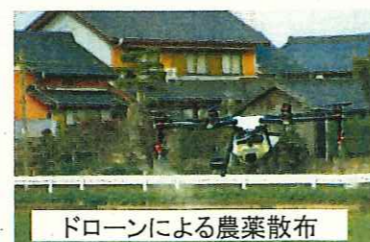
ドローンによる農薬散布