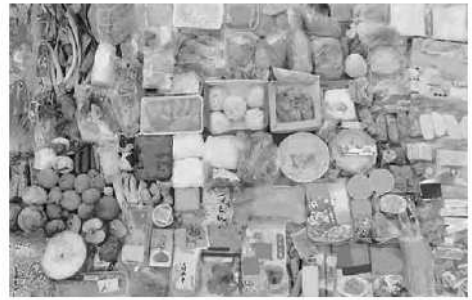
捨てられた手付かずの食品例

食べられるのに捨てられている食品ロスのこと。 日本では、年間600万トン以上の食品ロスが発生しています。 食品ロスの中には、手付かずの状態ですべて捨てられている食品もあり、この状況を多くの方に知っていただくことが大切です。