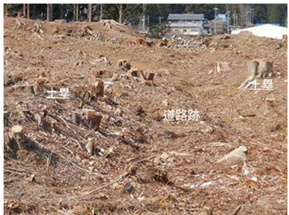
調査前の様子（道路跡・土塁、南から）