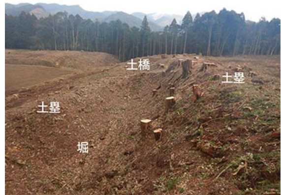
調査前の様子（土塁・堀・土橋、西から）