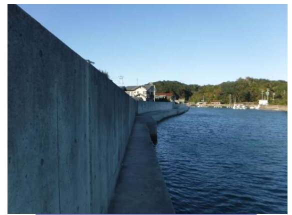
現在の護岸整備状況