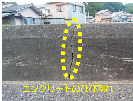
既設護岸状況 （老朽化）