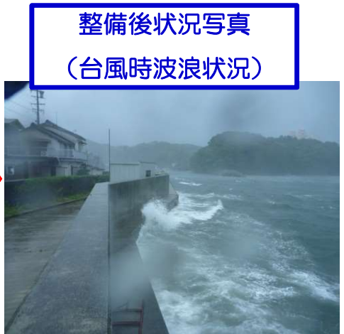
整備後状況写真 （台風時波浪状況）