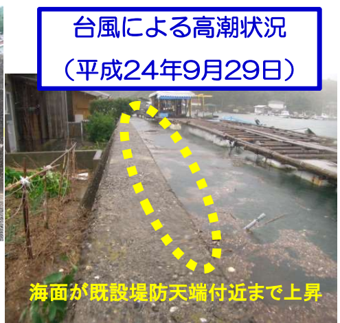
台風による高潮状況 （平成24年9月29日）