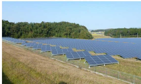
分散配置、芝草植栽により、眺望に配慮