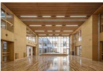
亀山市立川崎小学校