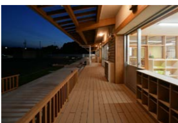
大台町立日進保育園