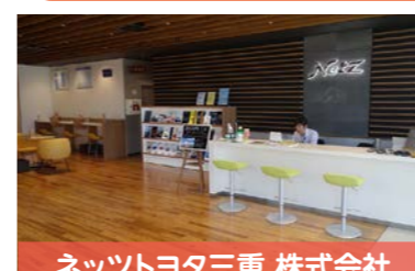
ネットヨタ三重 株式会社

店舗等の改装や改築、木製キッズコーナーおよび木製遊具の設置などに、三重県産の木を活用。