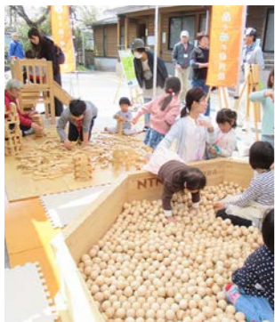
三重県産の木でできたボールプールやキッズスペース