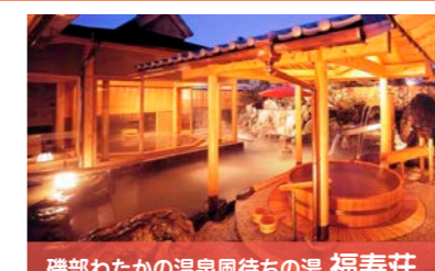
磯部わたかの温泉風待ちの湯 福寿荘

店舗等の改装や改築、木製キッズコーナーおよび木製遊具の設置などに、三重県産の木を活用。