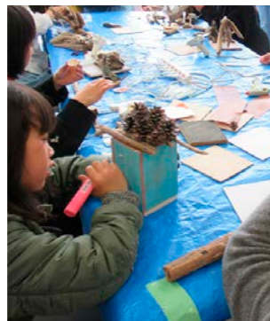
木工クラフトなどの多彩なワークショップ

各イベントで「森の学校」、「ミエトイ・キャラバン」を実施します！ぜひご参加ください！（参加無料・事前予約不要）