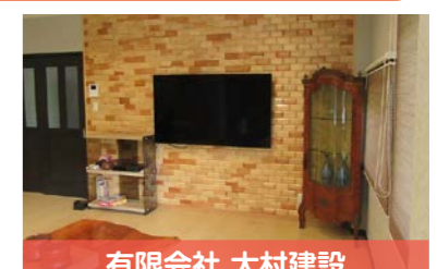
有限会社 大村建設

バリアフリー客室や浴室の改修、施設内の額縁などに、尾鷲ヒノキなど三重県産の木を活用。