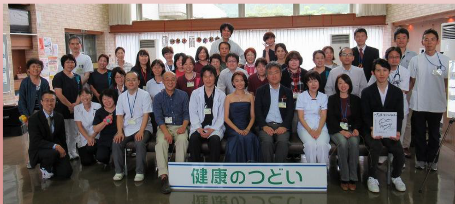
● 健康のつどい 2019 集合写真 (10月19日)