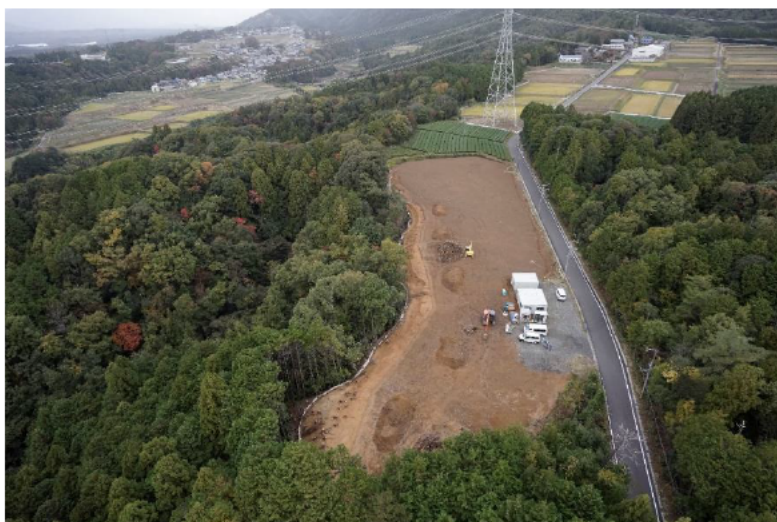
調査区全景（南から）