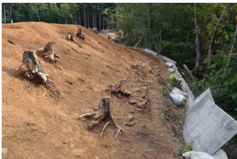
調査区中央部斜面（北から）

今回の調査では、遺物は出土しませんでした。地山を削り出して整形したと考えられる土塁状の高まりや斜面、通路状の平坦地を確認しました。田辺城の調査は来年度以降も行われる予定です。