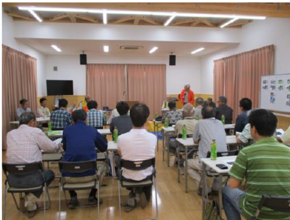
先進地視察（亀山市関町久我地区）