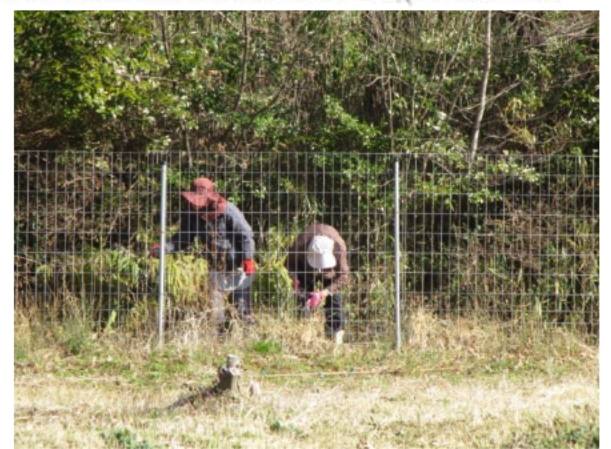
防護柵の点検・管理作業