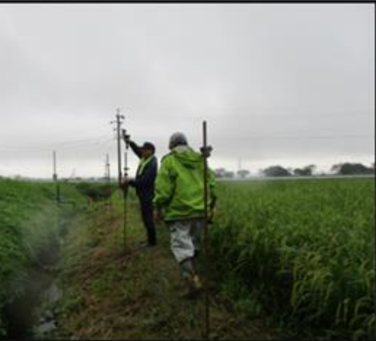
1125にシカ対策として新たに電気柵を設置