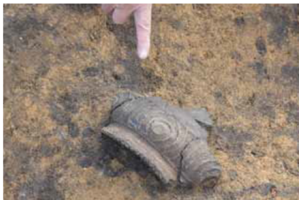
土坑5から出土した縄文土器 北白川下層Ⅲ式（関西系）の土器です。