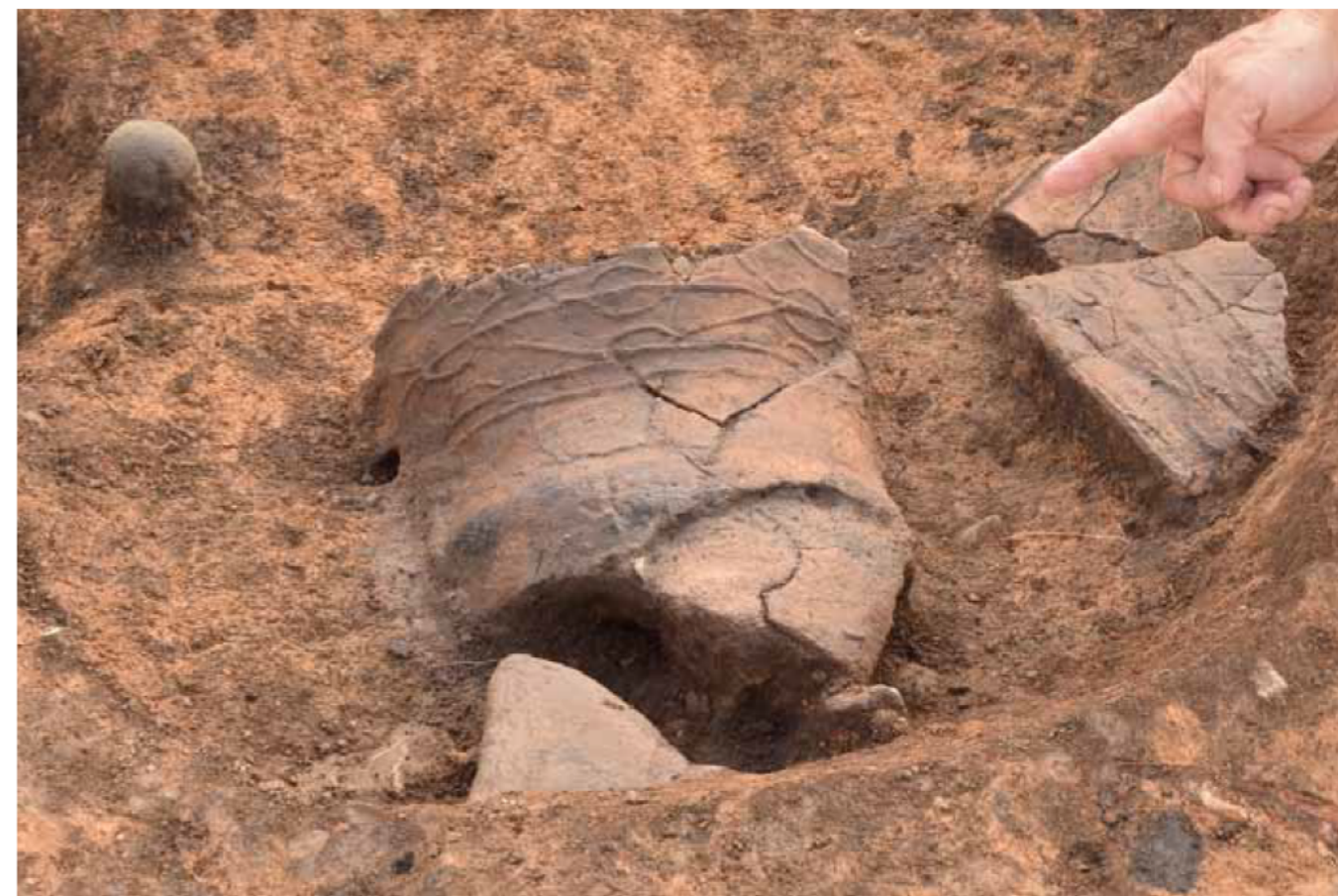
みつかった縄文土器深鉢（土坑6、北から）

まとめ 今回の調査では、縄文時代前期の竪穴建物が3棟、墓の可能性のある楕円形の土坑32基、弥生時代中期の竪穴建物が1棟みつけられました。縄文時代前期の竪穴建物は、昨年度みつかったものと合わせると7棟となり、この時期としては県内最多例となります。竪穴建物には3～4m程度の小型のものと、5～6m程度の大型のものがみられることや、墓の可能性のある土坑がまとまってつくられていることなど、当時の集落のようすも少しずつ分かってきました。