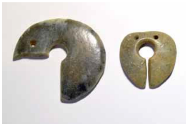
玦状耳飾（けつじょうみみかざり） 左：径約6cm。（土坑2より出土。左下欠損。） 右：径約4cm。（土坑3より出土。）