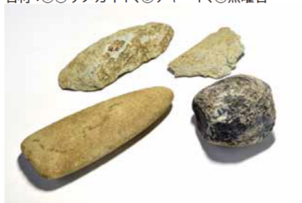
上段左：石斧折損未成品（作る途中で折れたもの） 上段右：剥片（はくへん） 下段左：磨製石斧 下段右：敲石（たたきいし）