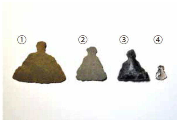
石匙（いしさじ） 石で作られた携帯用のナイフと考えられています。 石材：①②サヌカイト、③チャート、④黒曜石