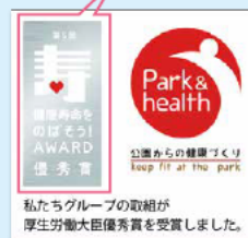
私たちグループの取組が 厚生労働大臣優秀賞を受賞しました。