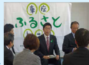
愛知県蒲郡市 車座ふるさとトーク