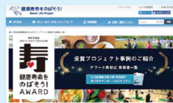
スマート・ライフ・プロジェクト ウェブサイト