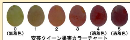
「安芸クイーン」専用果実カラーチャート