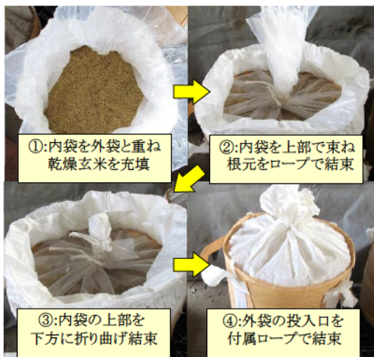
図 1. 飼料用米の充填から内袋結束作業