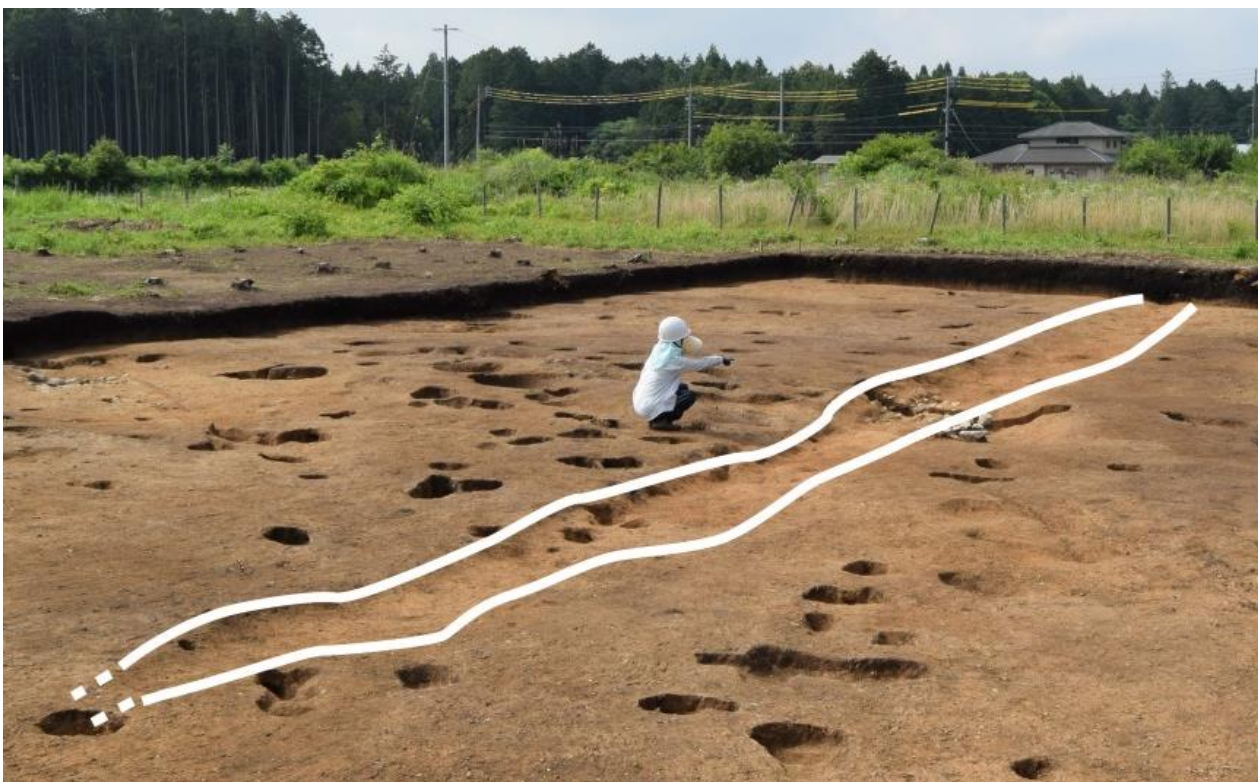
江戸時代の地割り溝2。南北に約23m、幅は広い所で約2m、深い所で約25cm。