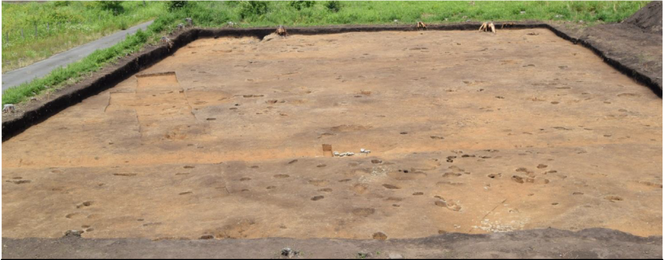
6工区完掘状況全景（東から撮影）