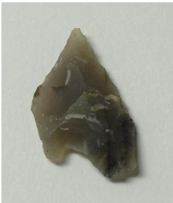
竪穴建物3から出土した石鏃 せきぞく (矢じり)。 たて約17mm、よこ約10mm。