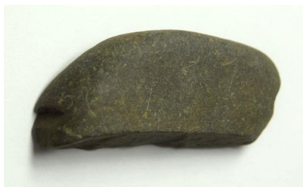
竪穴建物1から出土した石錘 せきすい (おもり)。 たて約16mm、よこ約34mm。