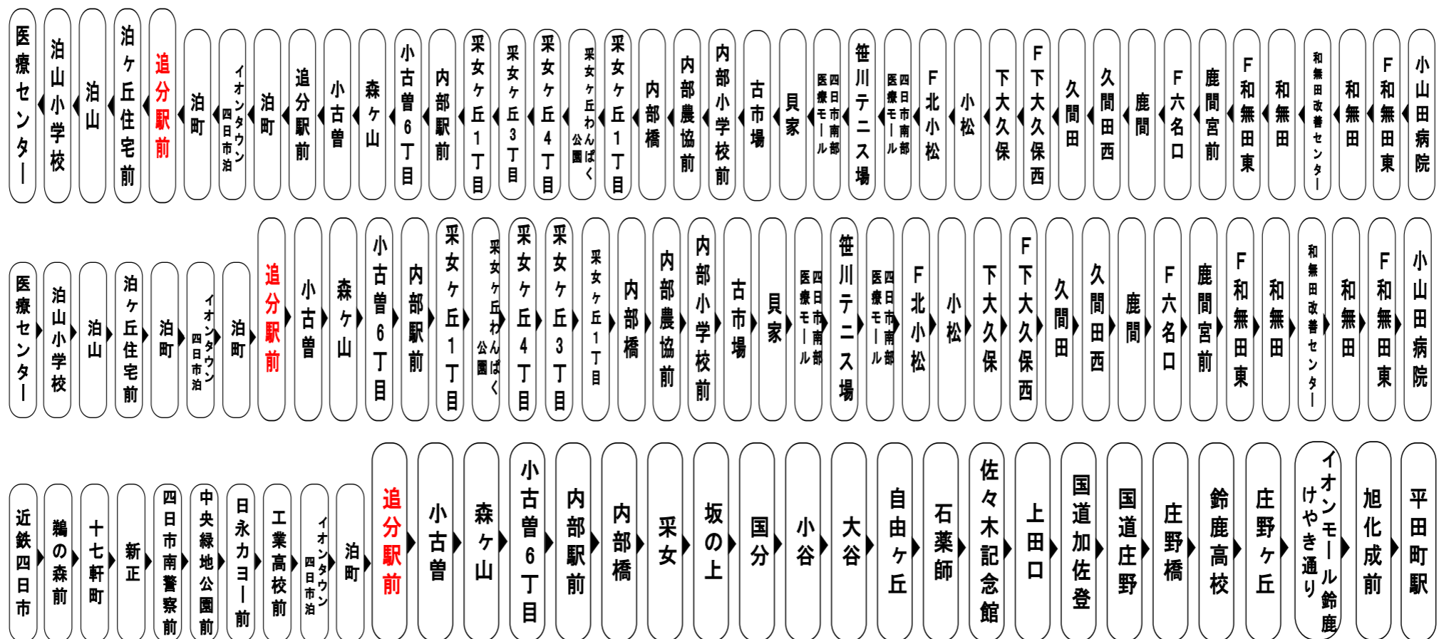
Yokkaichi bus location system