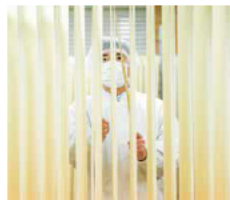
「日本の麺」 株式会社 坂利製麺所

大工道具の製造を通じて培った精緻な技術と理念を活かして作られたキッチンツールブランド「DYK（ダイク）」。三条市の教育講座を通じて生まれたブランドです。2018年にブランドデビューし、順調に販路を拡大中。