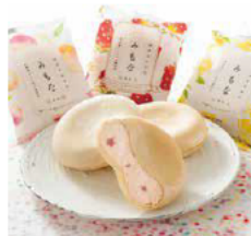
「みもな」 第一食品 株式会社

日本の四季をテーマに、国産果実と奄美産さとうきび糖で作ったやさしい甘さのプレミアムモナカアイス「みもな」。三条市の教育講座の成果発表会で生まれたブランドです。コンビニにも採用され、初年度10万個目標が30万個の販売を記録しました。