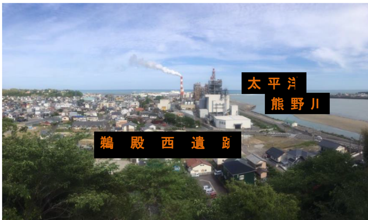
▲鵜殿城跡から展望した鵜殿西遺跡

平成30年度の調査では、鎌倉時代から江戸時代の集落跡がみつかりました。今年度の調査は昨年よりも広い面積を調査するため、さらに詳しい発掘成果が期待されます。