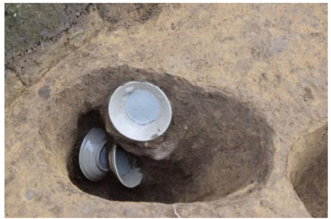
小穴から出土した小皿（江戸時代前半）