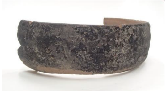
播磨産の鍋（江戸時代中頃）