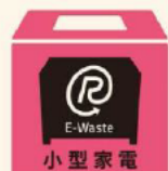
このマークが小型家電回収の目印です

市役所などの公共施設、またはスーパー、家電量販などの小売店に、回収ボックスが設置されている市区町村もあります。ごみ回収の区分に「小型家電」がある市区町村もあります。詳しくはお住まいの市区町村にお尋ねください。