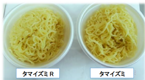
図 2 「タマイズミ R」の中華麺