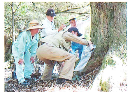
津市美杉町 東平寺のシイノキ樹叢樹木健康診断