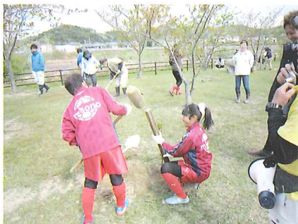
伊勢市 春期緑化運動 朝熊山麓に花を咲かす会

県下の巨樹・古木や公共用地の樹木・森林の樹木健康診断を樹木医が24カ所で行いました。