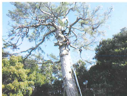
志摩市 布施田自治会 庚申堂の天狗松保護